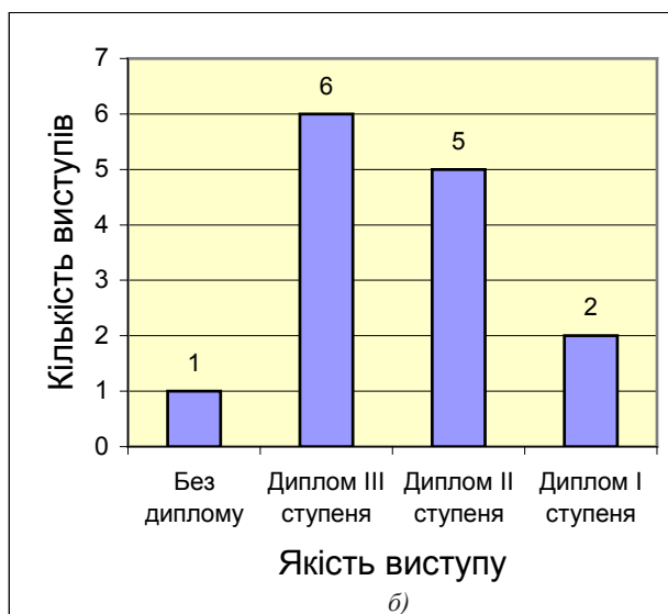
Рис. 1. Діаграми результатів виступу учнів в обласних (а) та державних (б) етапах Всеукраїнського конкурсу-захисту науково-дослідницьких робіт учнів – членів МАН України (2008–2016 рр.)