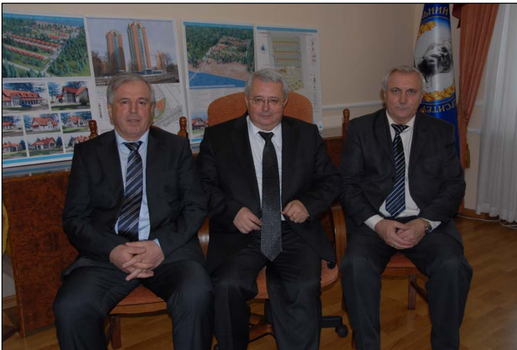
Нас об'єднує бажання допомагати кожному студенту стати особистістю і висока відповідальність за долю драгоманівського університету