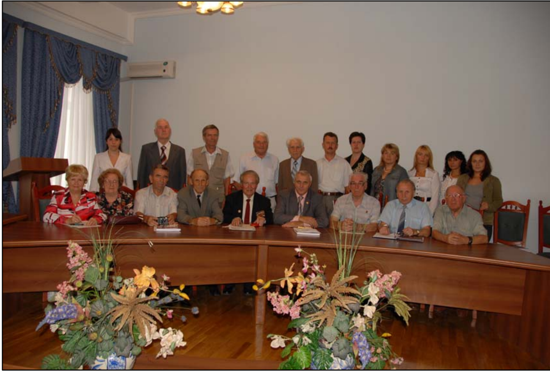
Серед ветеранського активу НПУ імені М. П. Драгоманова (2009)