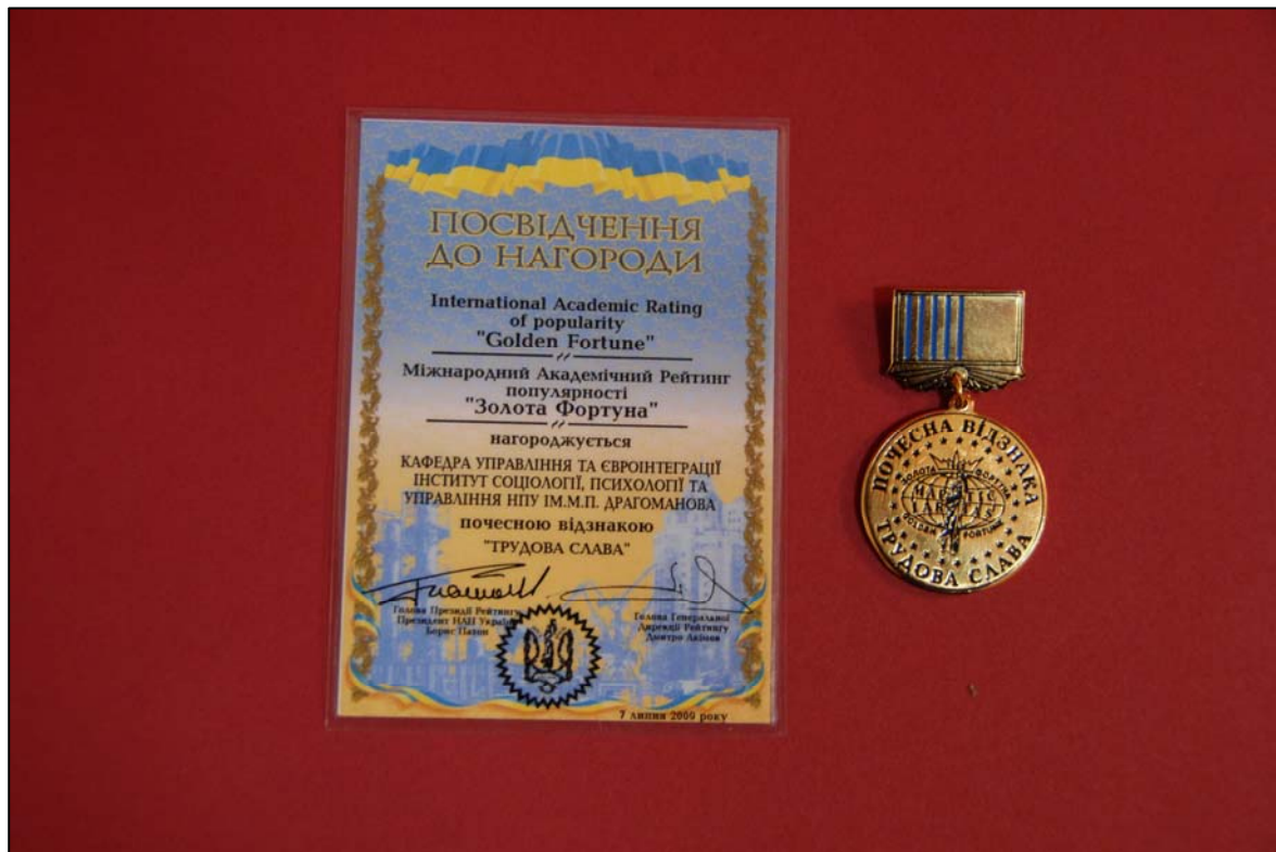
Почесна відзнака “ТРУДОВА СЛАВА” за вагомий внесок у справу розбудови України та розробку інтелектуальних засад інформаційного суспільства