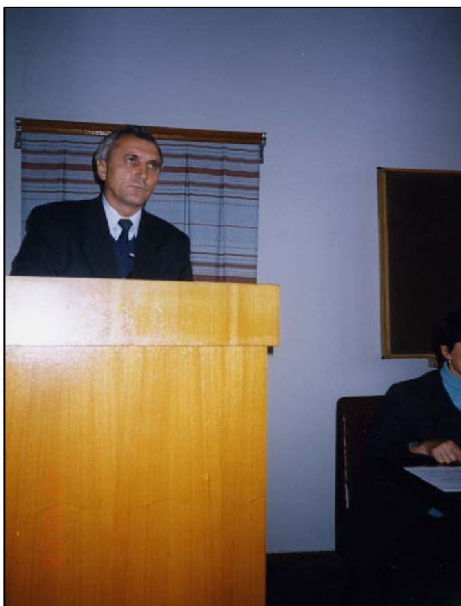
У день захисту докторської дисертації в Інституті філософії імені В. Г. Корецького НАН України (1999)