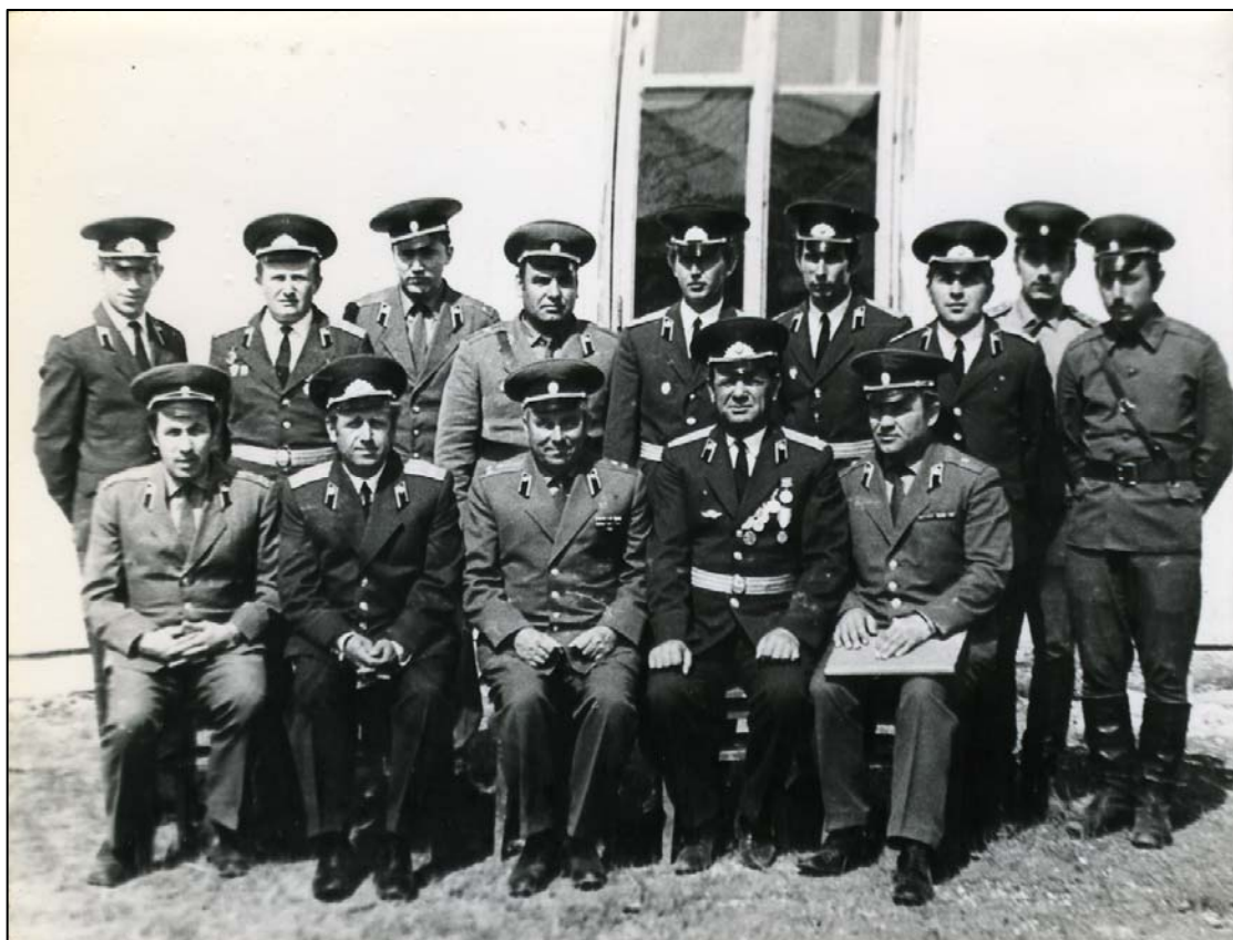
Офіцери мого полку у диких степах Казахстану (1976)