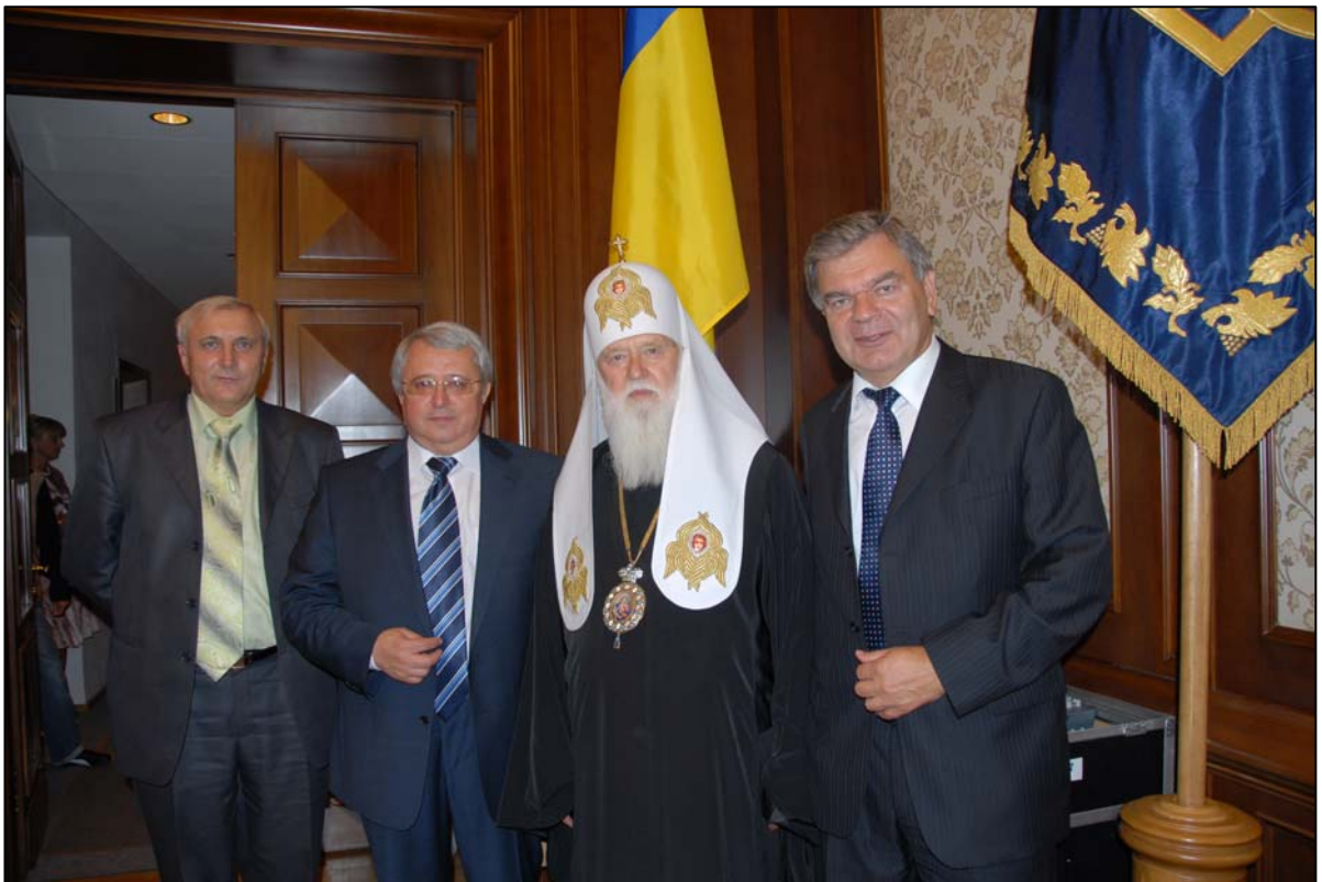
На прийомі у його святості Філарета (2009)