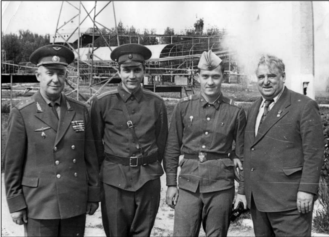
На зборах десантників у м. Пскові з легендарним тренером збірної СРСР з хокею А. Тарасовим