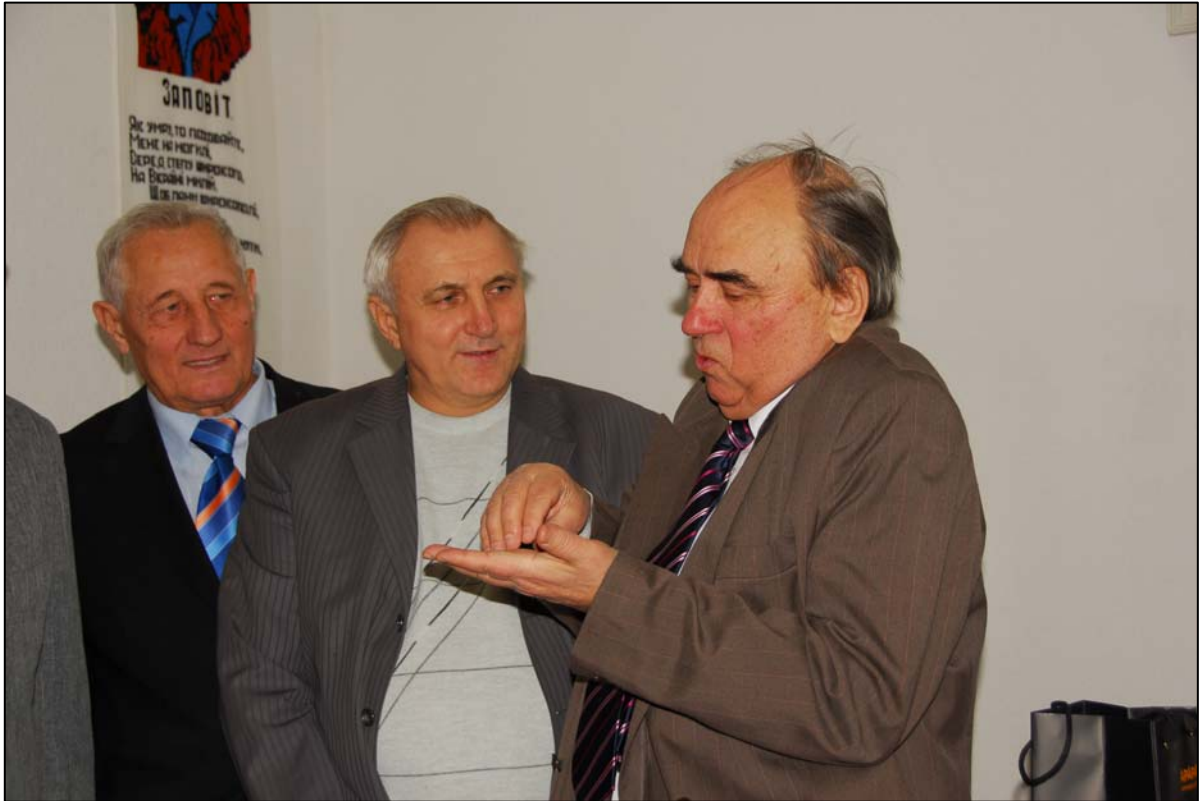
З аксакалами університету завжди цікаво