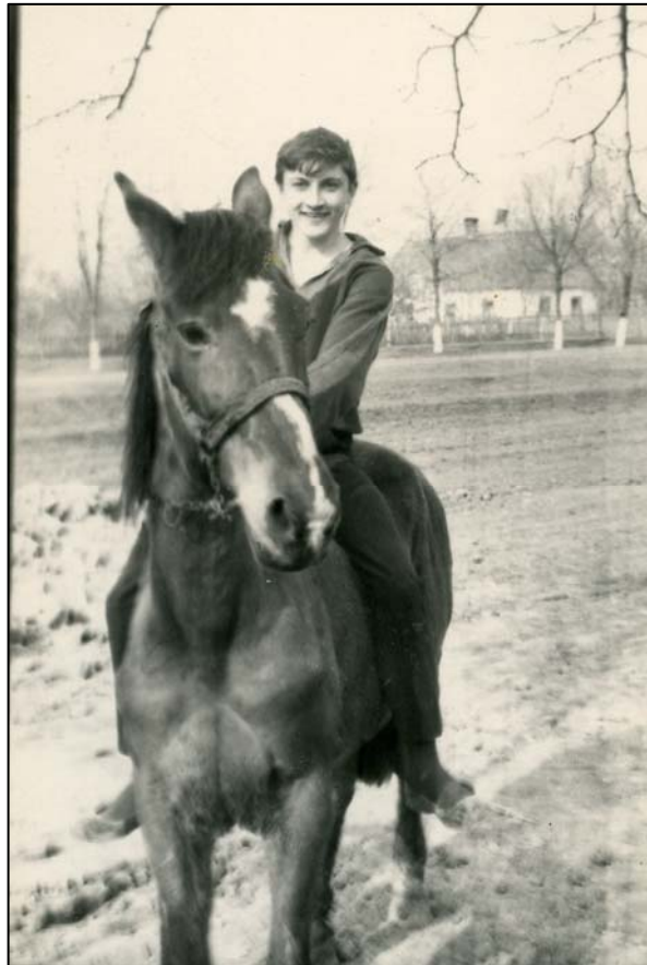
На Байкалі (1971)