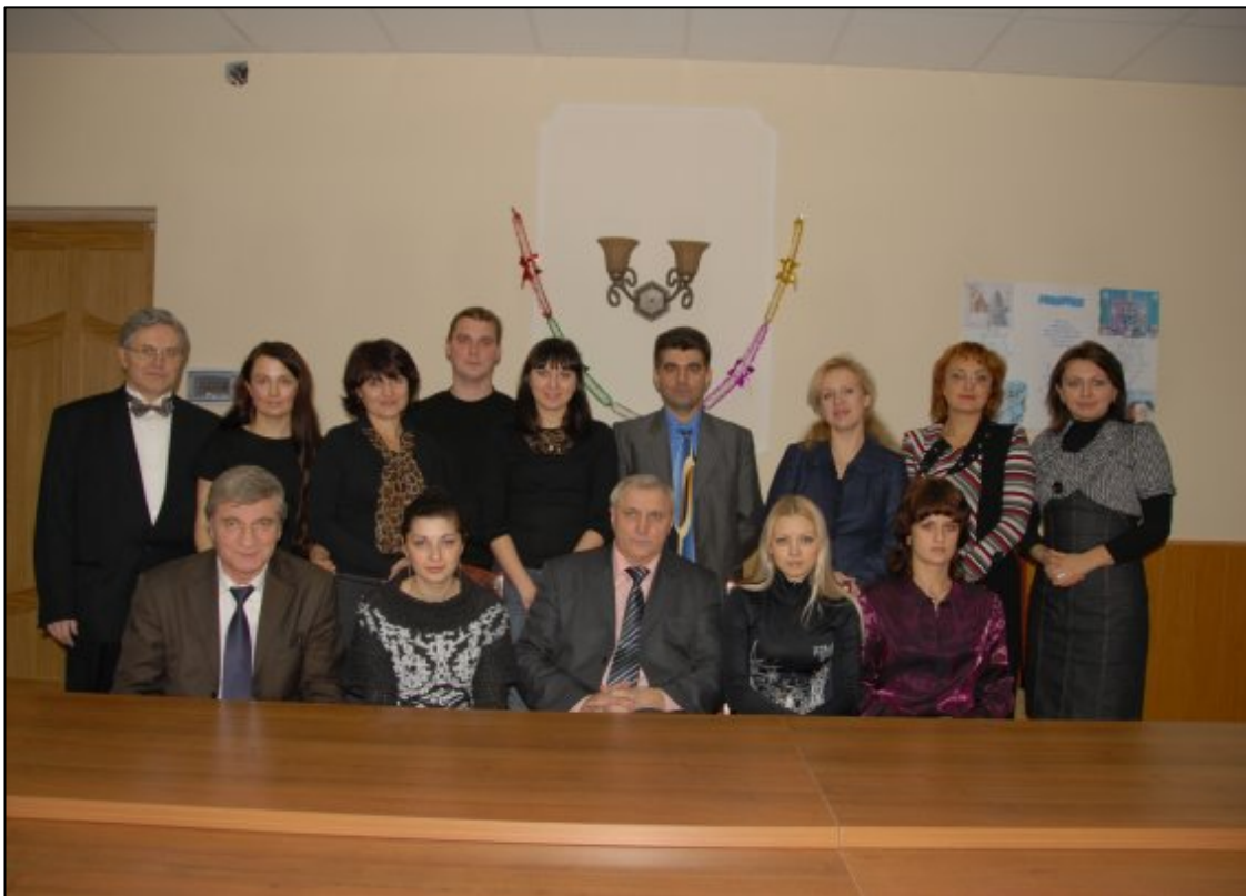
Моя рідна кафедра (2009)