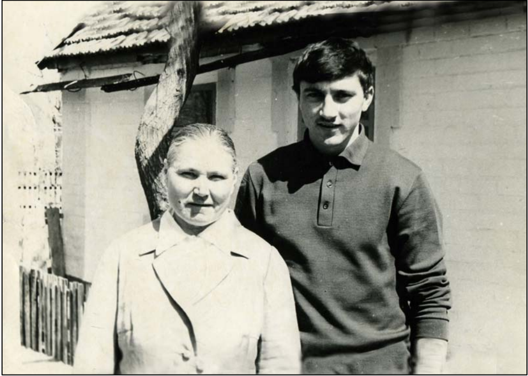
Разом з мамою завжди затишно (1975)