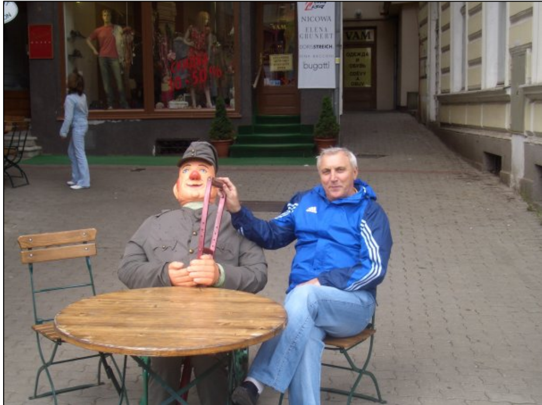
У гостях у Швейка (Прага, 2007)