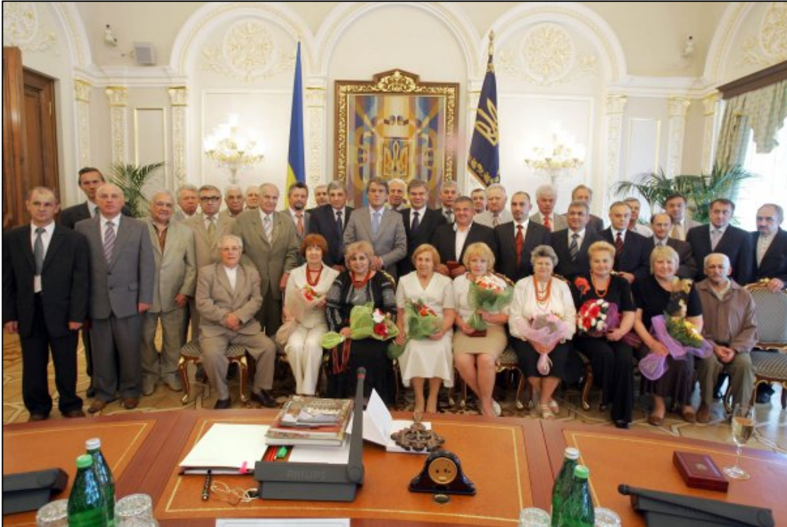
На прийомі у Президента України з нагоди присудження звання “Заслужений діяч науки і техніки України” (2007)