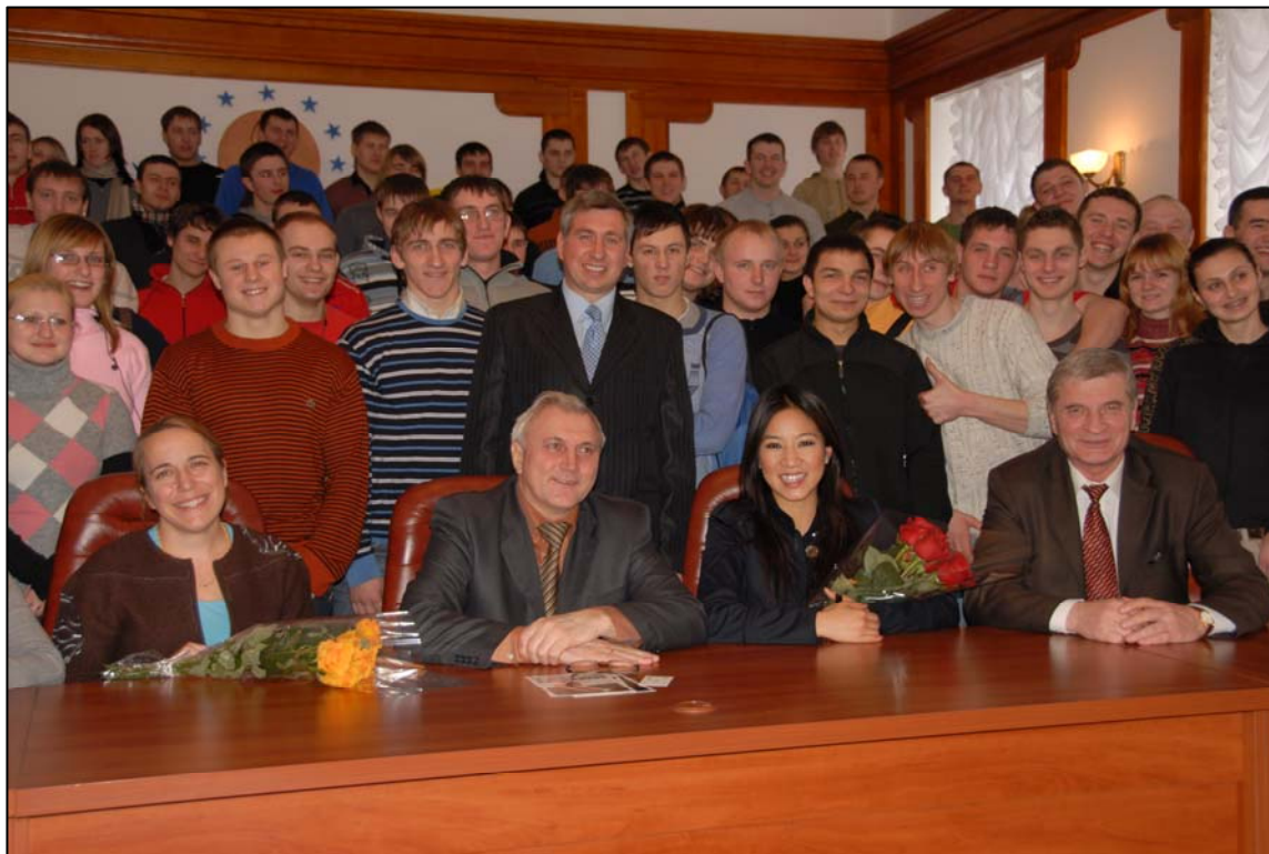
Зустріч з відомою американською фігуристкою Квін (2009)