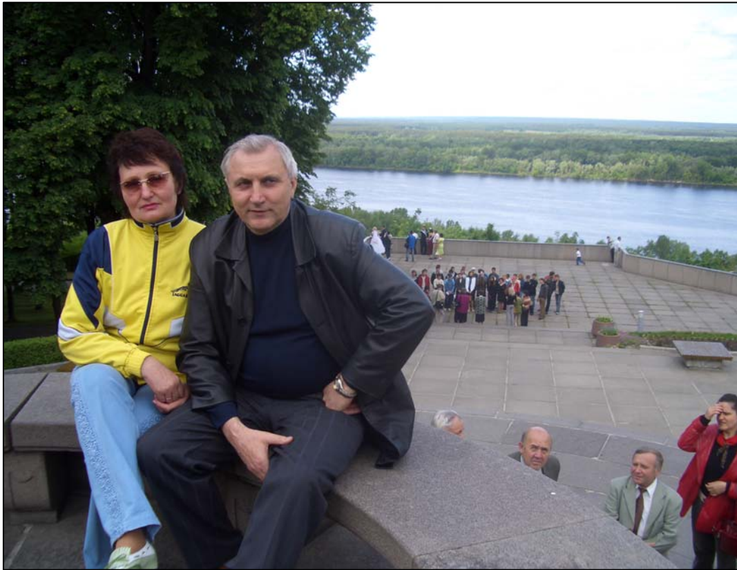
З дружиною у Каневі (2008)