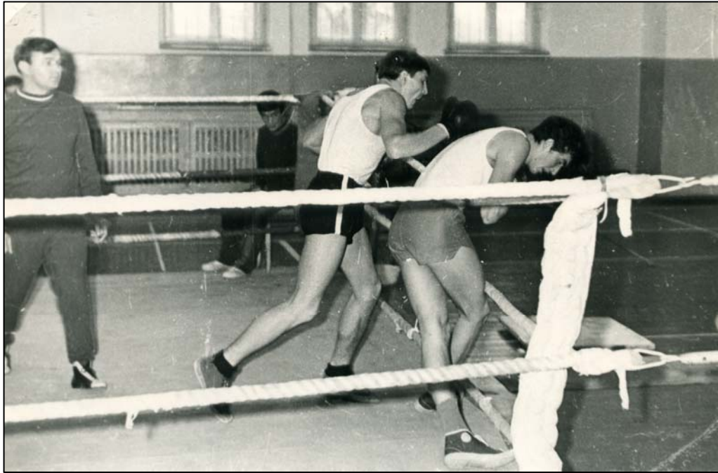
Безкомпромісна боротьба (1970)