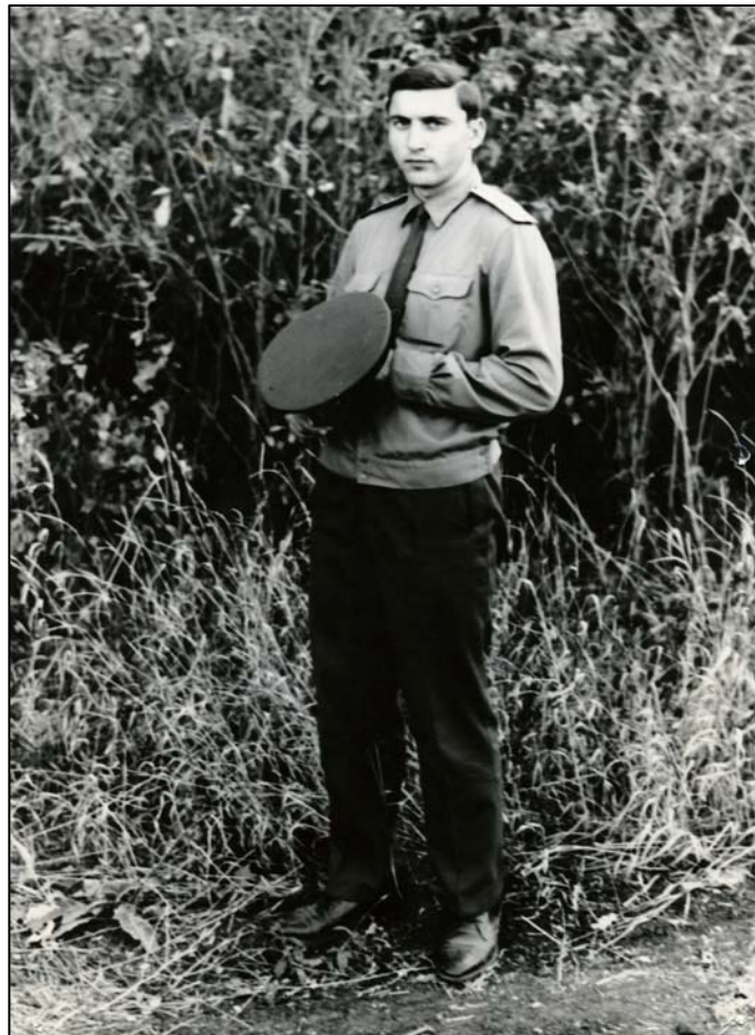
Служба в Армії (1976)