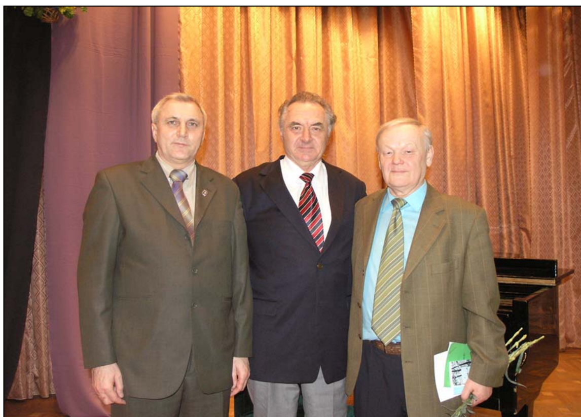
У колі митців (2009)