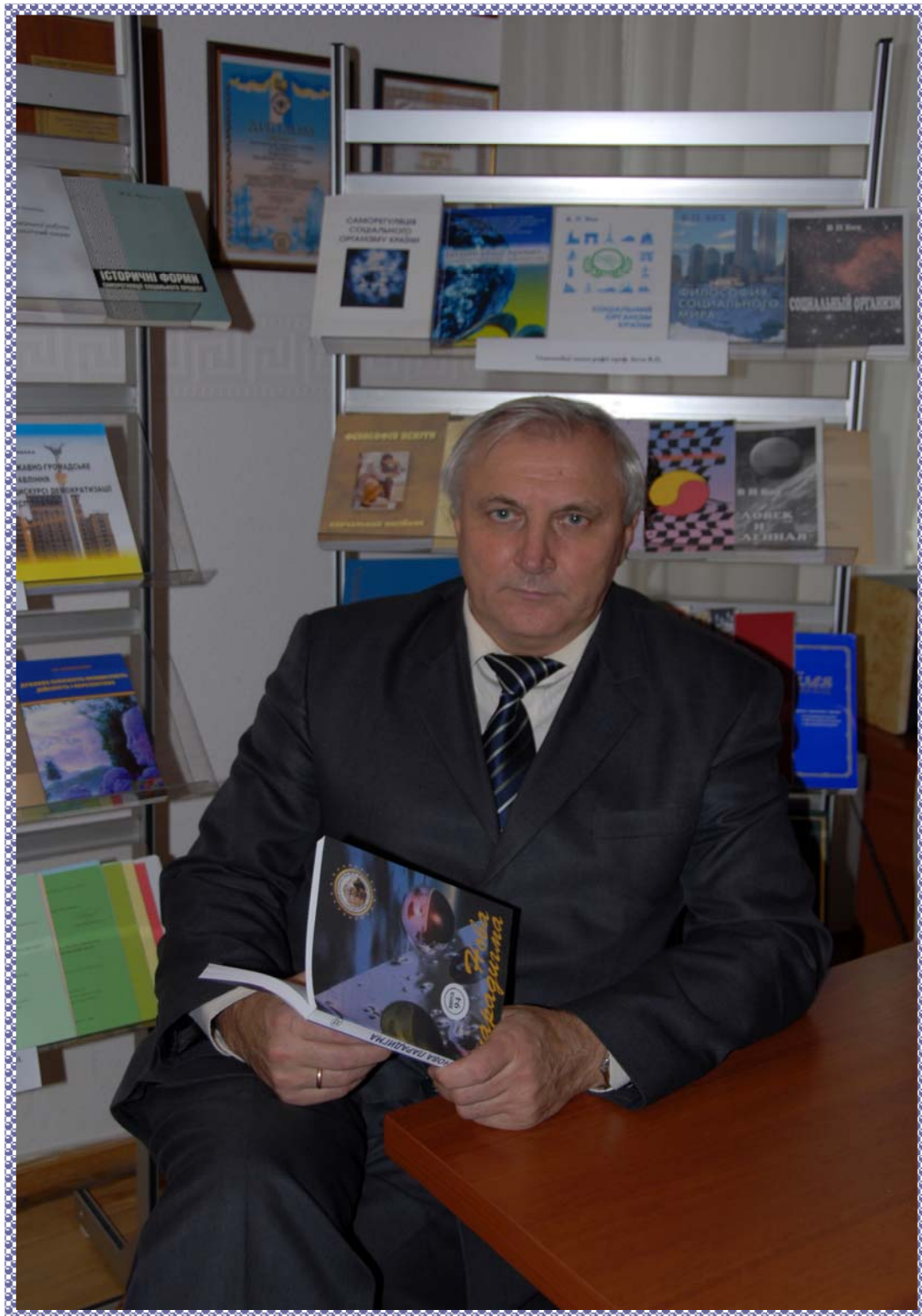
Володимир Павлович БЕХ – вчений, філософ, соціолог, політолог, спеціаліст із самоорганізації та саморегуляції соціальних систем, педагог