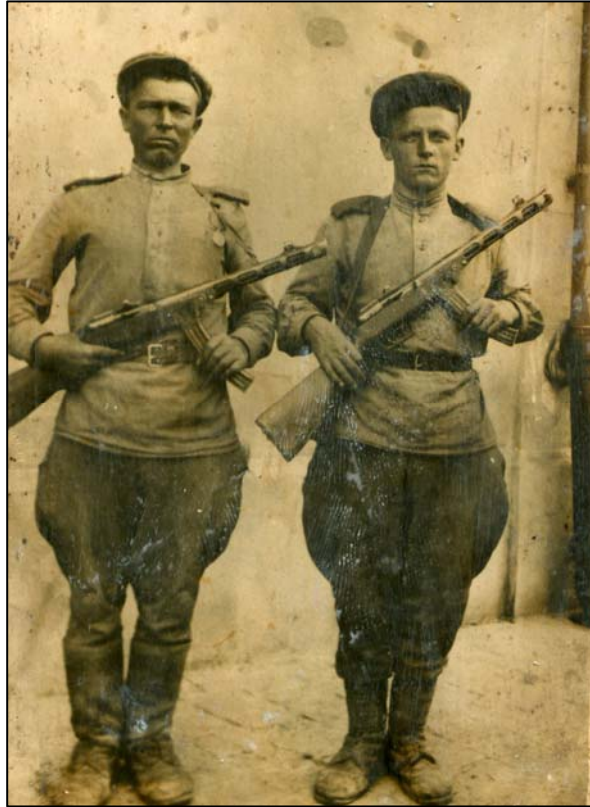
Батько – Бех Павло Григорович (зліва) у дні визволення Румунії (1944)