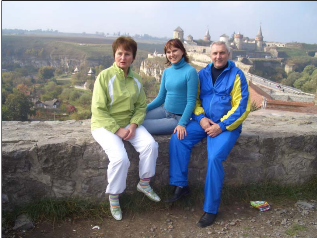
Відвідування історичних місць – наше сімейне хоббі (м. Каменець-Подільська фортеця, 2006)