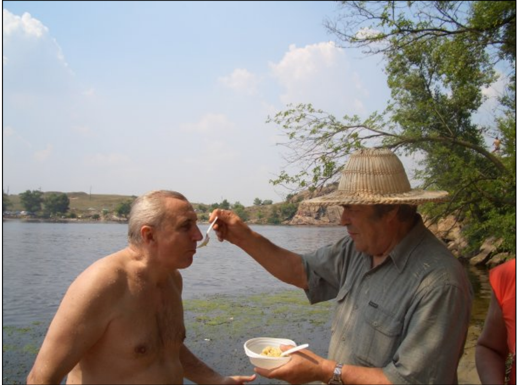
Коли козацький куліш солодший за мед (Хортиця, 2005)