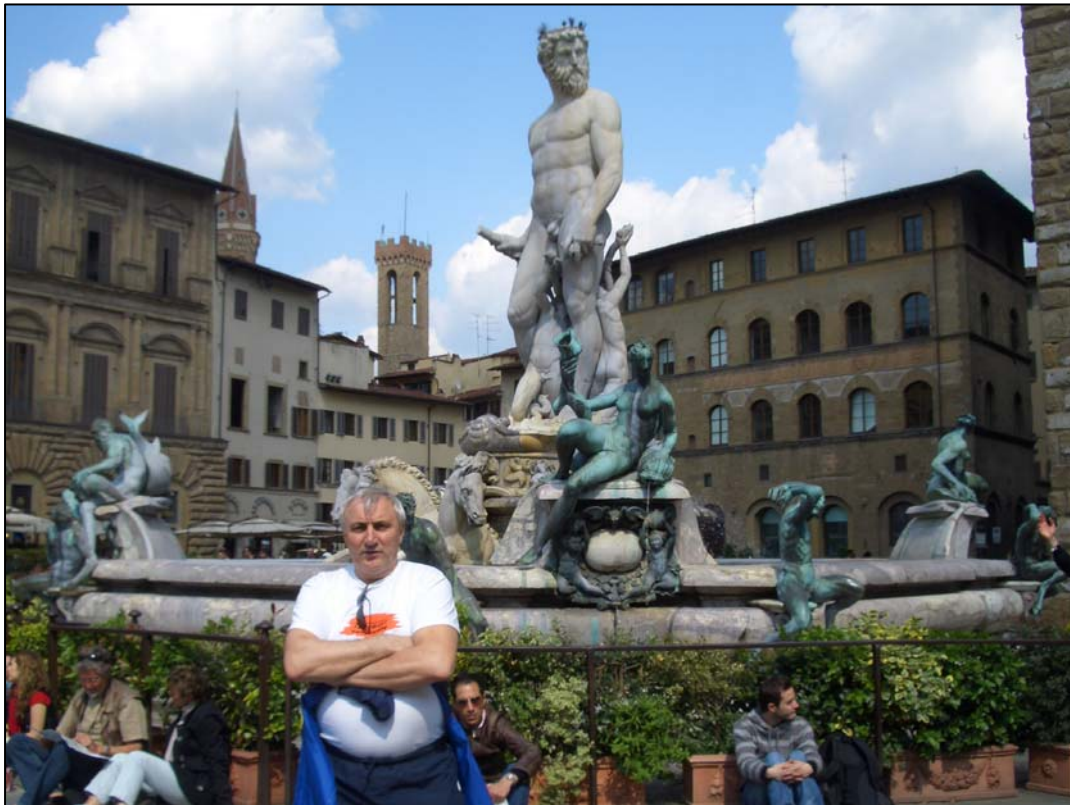
Біля відомого Самсона (Італія, 2008)