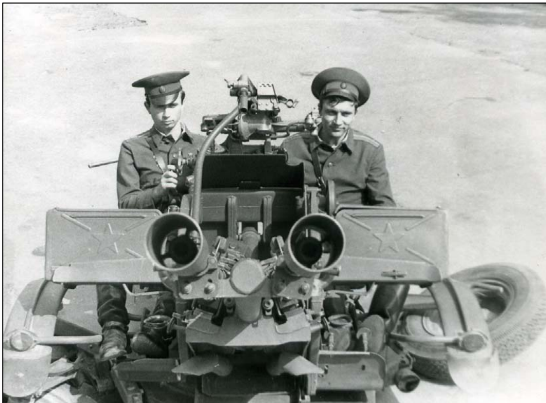
Армійські будні десантників (1978)