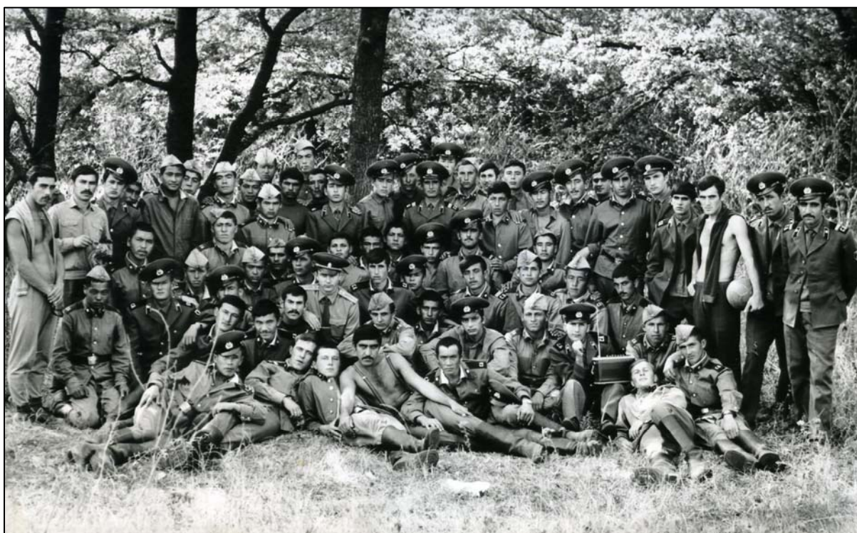
Моя 3-тя рота (1975)