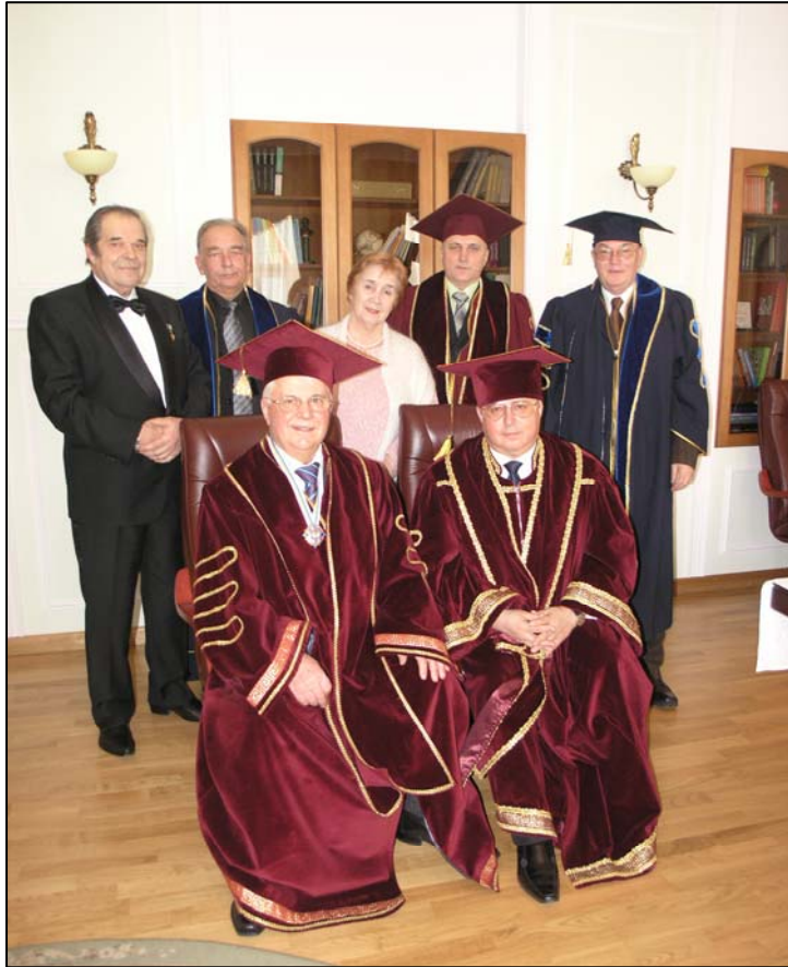
Ректорат університету вітає Почесного професора Л. М. Кравчука (2007)