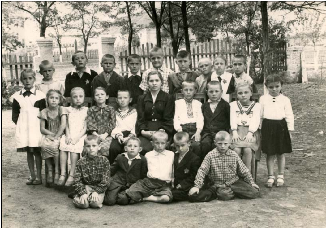
Перші кроки до знань (1958)