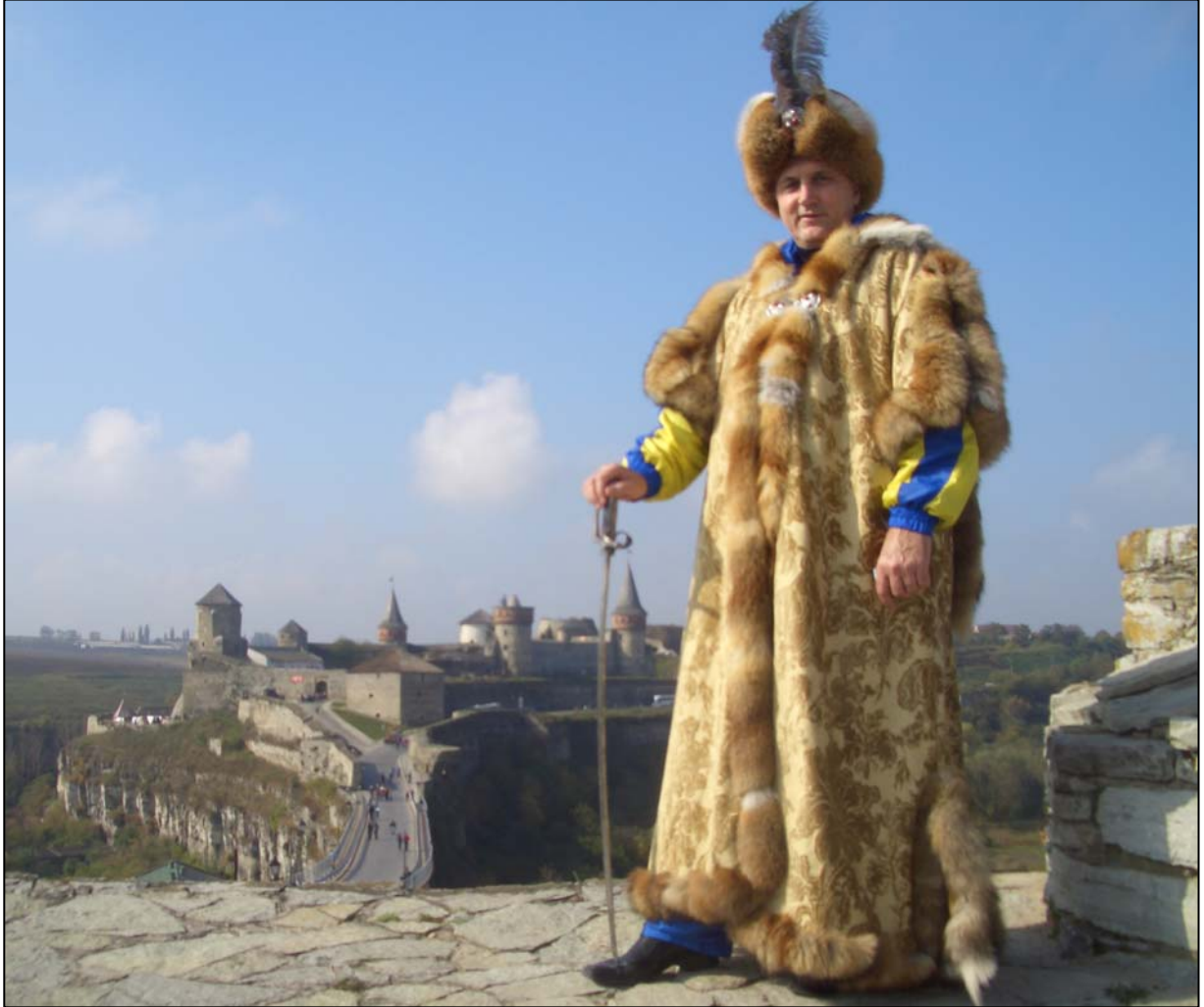
У Каменець-Подільському замку (2009)