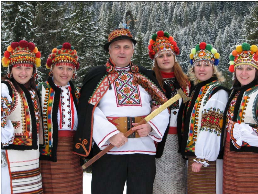
У високих горах Карпат (2005)