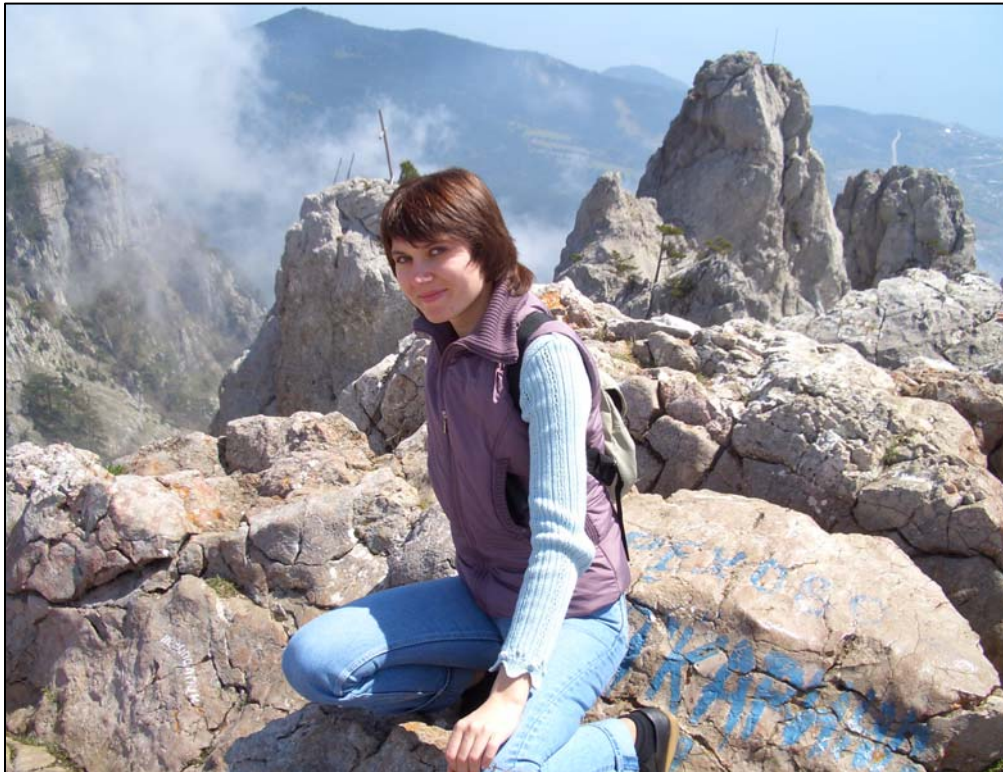
Батьківська школа – виживання у горах – корисна для доньки (Крим, 2003)