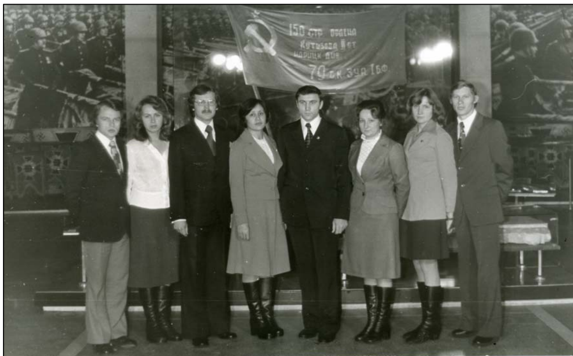
Актив ВКШ при ЦК ВЛКСМ у Прапора Перемоги (1978)