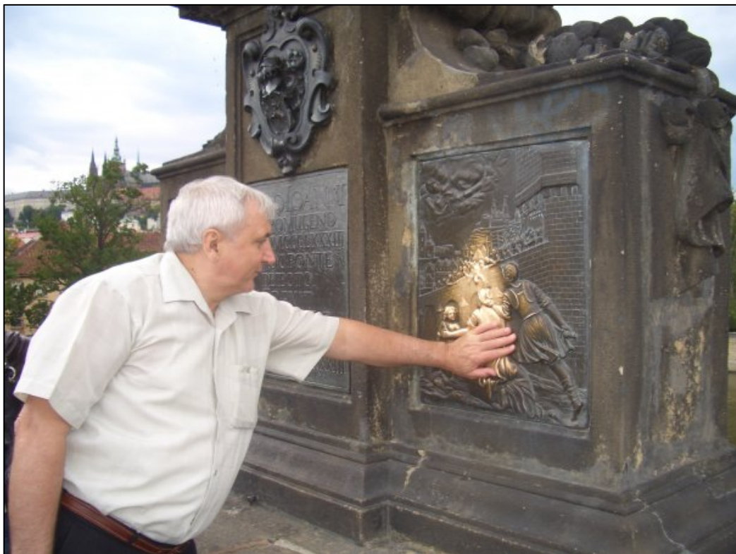
На Карловому мосту у Празі (2006)