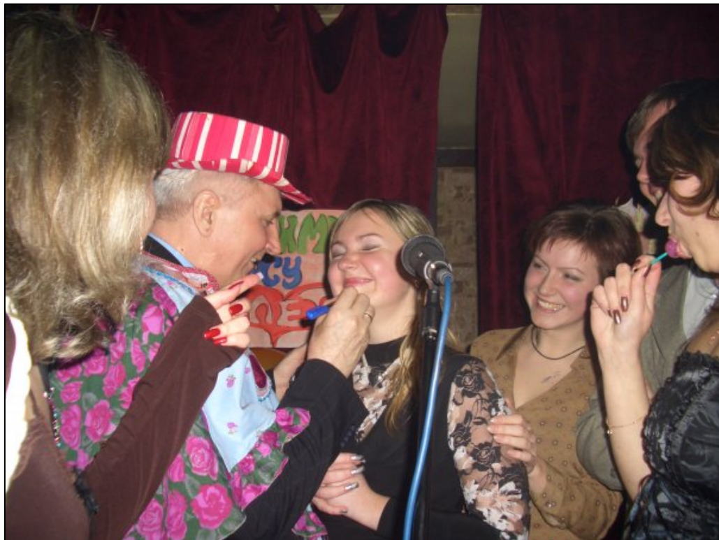
Студентський капусник (Запоріжжя, 2004)