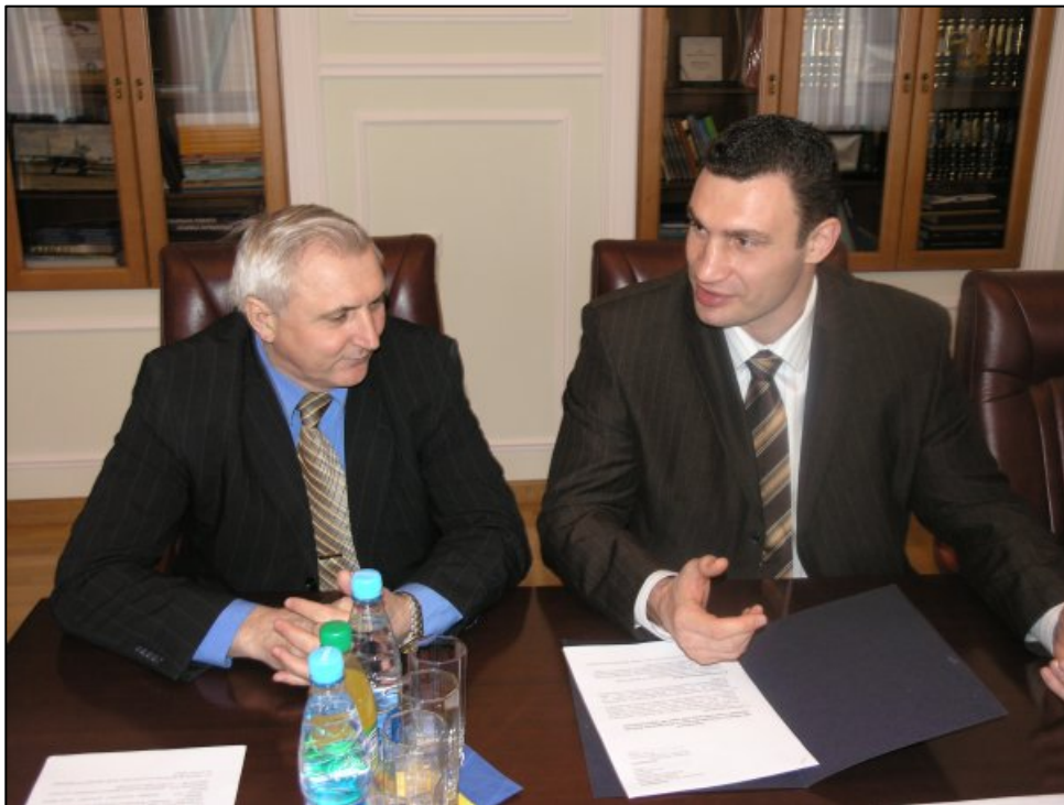
Зустріч з легендою світового боксу – Віталієм Кличком (2008)