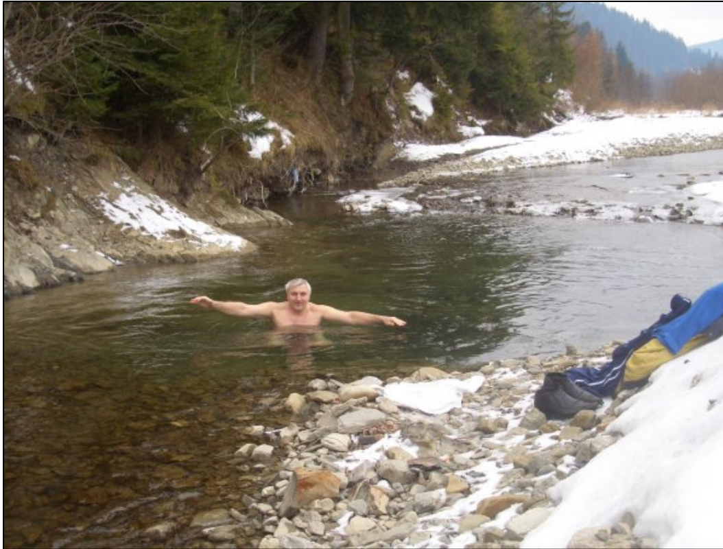
Новий рік у Карнатах (2007)