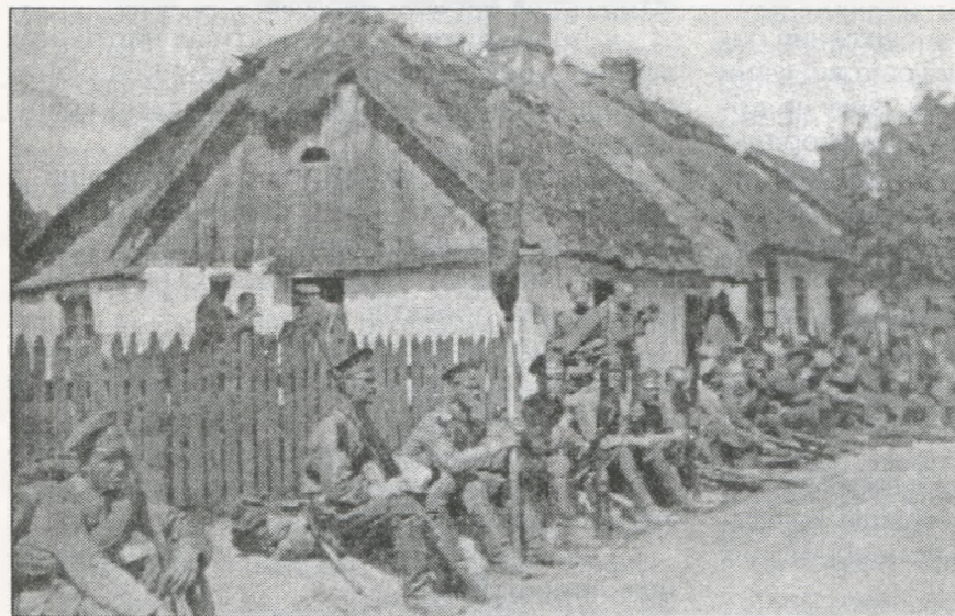
Російські війська в Галичині.

Підкреслювалось, що радянські історики й науковці країн з "соціалістичної співдружності" основні зусилля зосереджували на висвітленні певних аспектів революційного робітничого руху під час війни, стверджуючи, що най-