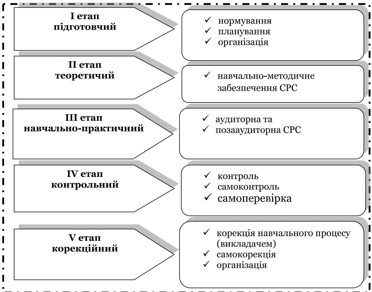
Рис. 1 Етапи самостійної роботи (складено автором на основі [4]).

Організація СПР з боку ІФНМУ здійснюється за п'ятьма етапами (рис. 1): підготовчим, теоретичним, навчально-практичним, контрольним, корекційним (рис. 1).