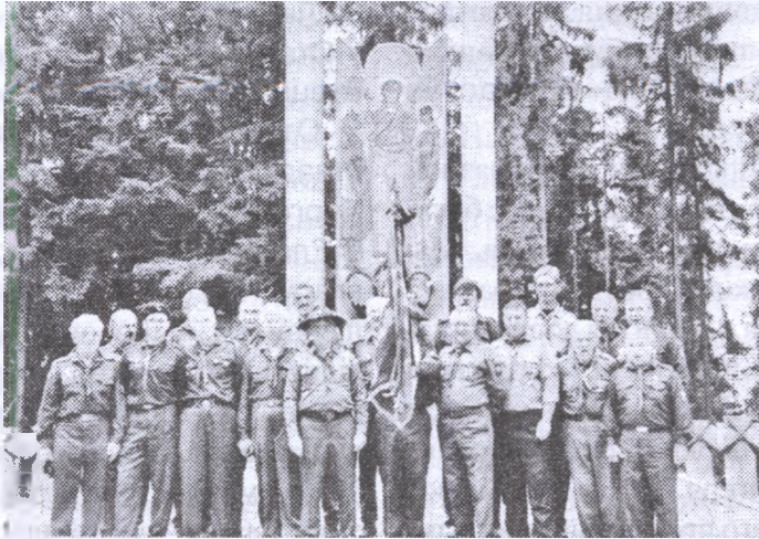
Члени загону „Червона Калина” біля пам'ятника полеглим Українським Січовим Стрільцям

вона, випробована різними життєвими бурями й негодами, перетривала й найбільш критичні моменти нашої новітньої історії. Залишається нам друга альтернатива: невластиве примінення пластової ідеї до специфічних обставин і умовин нашого хиття в Америці. В нашому житті мусіли зайти якісь дуже глибокі зміни, на які мало хто звернув належну увагу. Те, що двадцять літ тому було нам вповні вистачаючим, сьогодні виявляє певні недостачі. Коли говоримо про зміни, то це не значить, що ми погоджуємося з твердженнями деяких громадян, що наша молодь є «звихнена»,