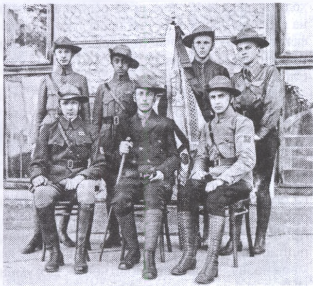
Організація українських скаутів – «Пласт»