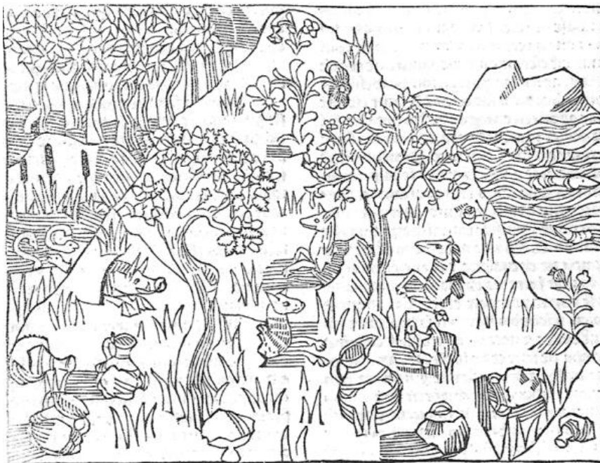
[Rysunek 1. Garnki oraz niektóre zwierzęta rodzą się w ziemi, Barthélémy de Glanville, Le Livre des Propriétés des Choses , Lyon ok. 1485 r., zob. 5]

Przedstawiony drzeworyt ukazuje górę położoną nad wodą, u podnóża której, między dwoma drzewami wyłaniają się z ziemi zwierzęta: dzik i trzy zwierzęta podobne do saren oraz naczynia. Dwa z nich to jednuszne dzbany, dwa inne to dwuszne amfory, z kolei inne naczynie jest częściowo przykryte ziemią, widać ucho, ale nie można określić formy, natomiast pod dębem widać kształt, który może być zwierzęciem lub dalszym wyłaniającym się garnkiem. Skamieliny, które często wyglądały podobnie do istot znanych żyjącym ówczesnie ludziom, np. zęby rekina lub muszle morskich skorupiaków znajdowane na szczytach gór, które miliony lat wcześniej stanowiły dna mórz, budziły jeszcze większe zdumienie.