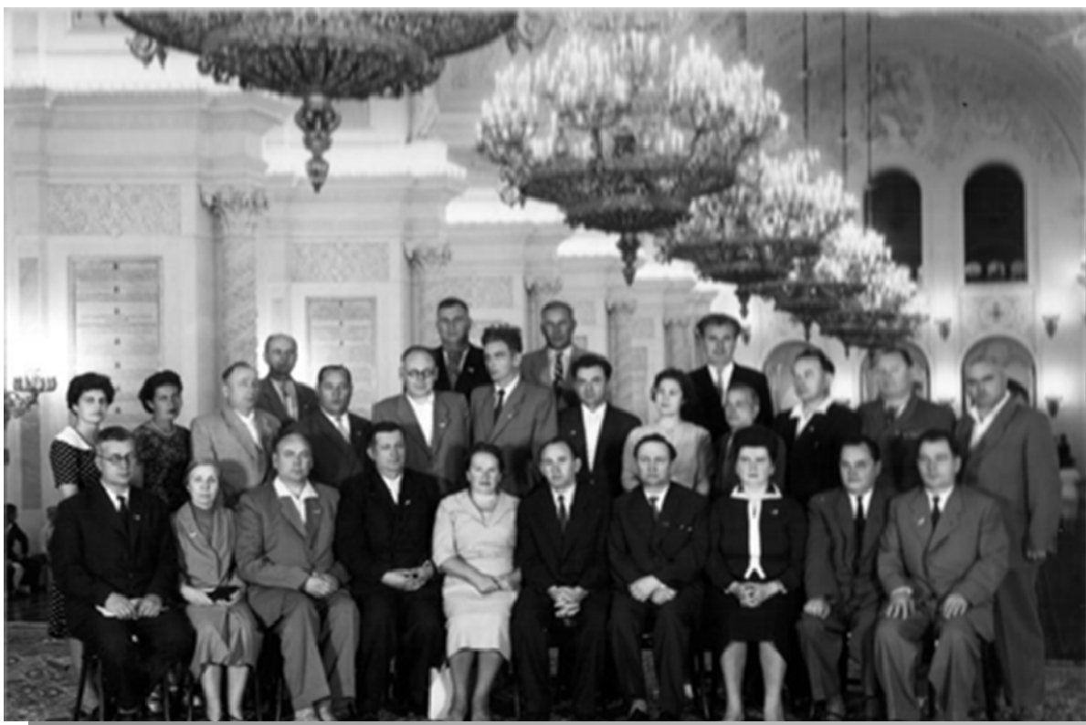
4-7 липня 1961 р., Москва. Марія Максимівна (в центрі) на Всесоюзній нараді працівників вищої школи

педагогічного університету імені М. П. Драгоманова – то перший крок ректора Київського педагогічного інституту імені О. М. Горького академіка Марії Максимівни Підтиченко. У правильності обраного Марією Максимівною європейського курсу академічного розвитку свідчить курс сучасної України на співпрацю у Європейському просторі.