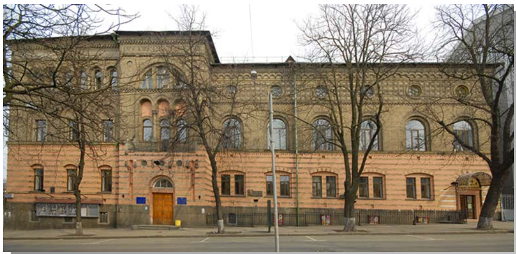
Київський державний інститут театрального мистецтва імені І. Карпенка-Карого