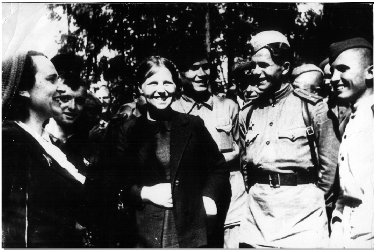
1942 рік. Істра. Партизанська бригада

визволення країни від німецьких окупантів, восени було звільнено Харків – колишню столицю республіки, і відразу розпочався важкий відбудовний період.