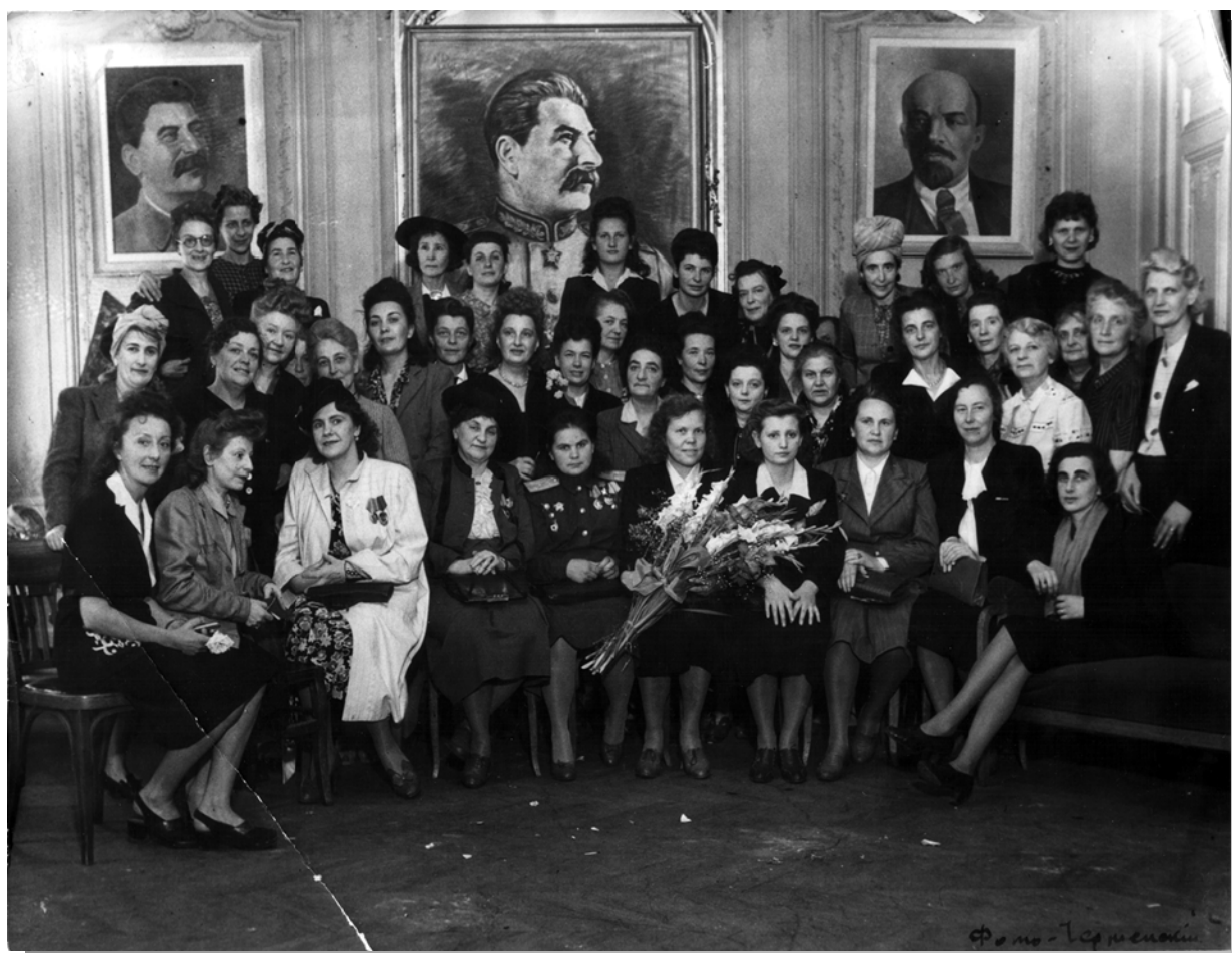
1953 рік. Московський конгрес МДФЖ