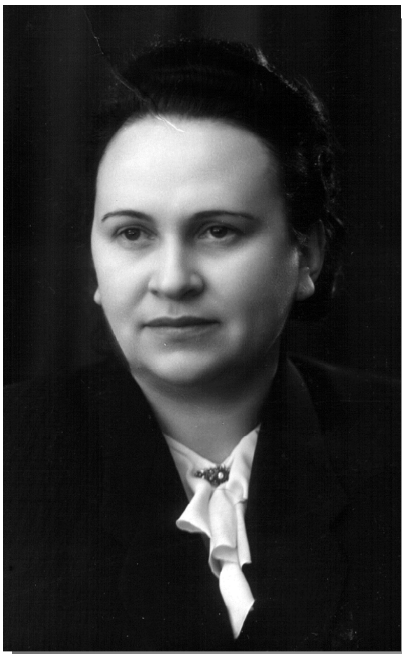
МАРІЯ МАКСИМІВНА ПІДТИЧЕНКО професор, дійсний член Академії педагогічних наук СРСР, ректор КДП імені О. М. Горького – НПУ імені М. П. Драгоманова у 1956–1970 рр.