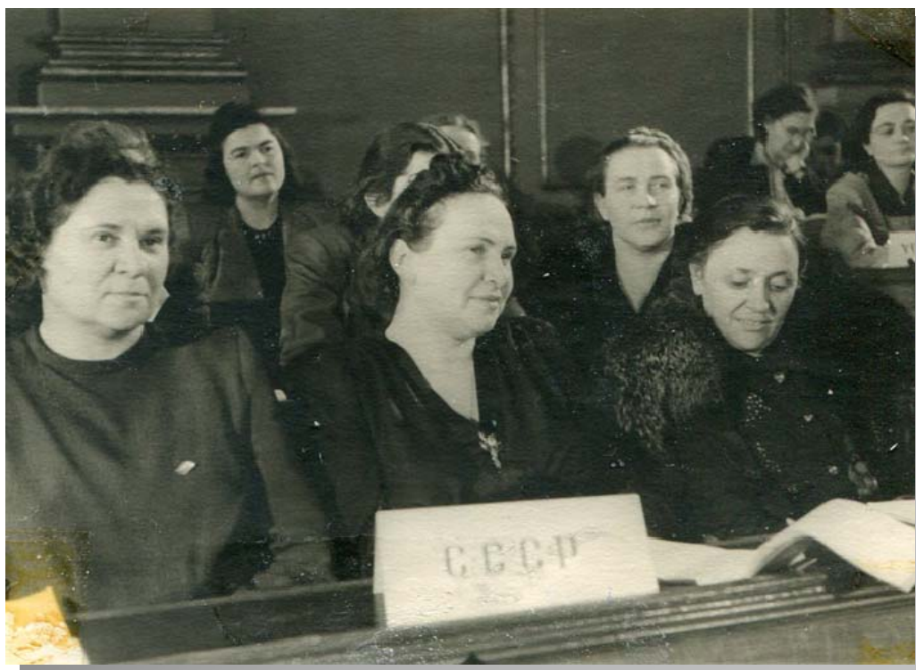
Делегація від СРСР на Конгресі МДФЖ

Антифашистські комітети жінок різних країн були складовою цією міжнародною організацією, яка збирала в свої ряди активні феміністські, пацифістські, антивоєнні жіночі організації світу.