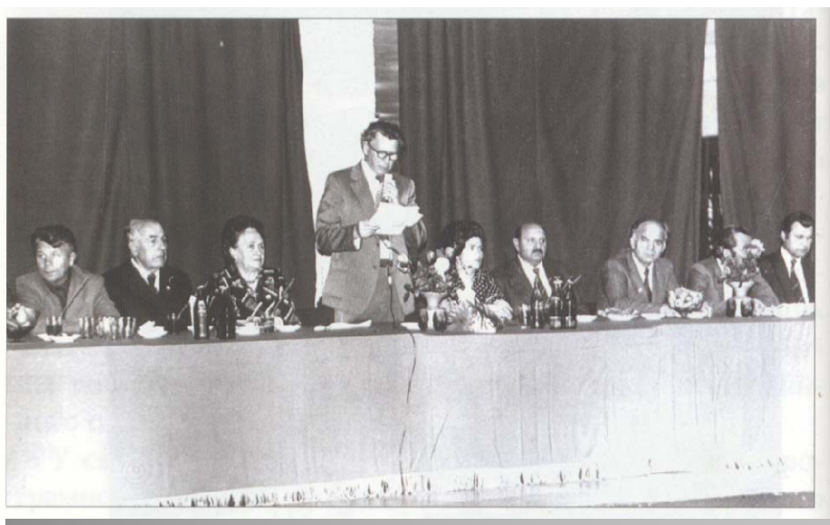
Марія Максимівна під час святкування 25-річчя Київської міської організації Товариства "Знання"

Серед різних категорій слухачів лунали її цікаві і зворушливі виступи.