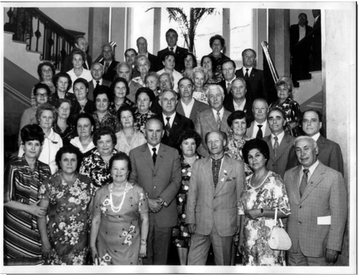
Світлини з річниць заснування ВЛКСМ

займається науково-педагогічною роботою в Київському університеті імені Тараса Шевченка, бере участь в організації Товариства "Знання", обрана секретарем Київського міськкому партії.