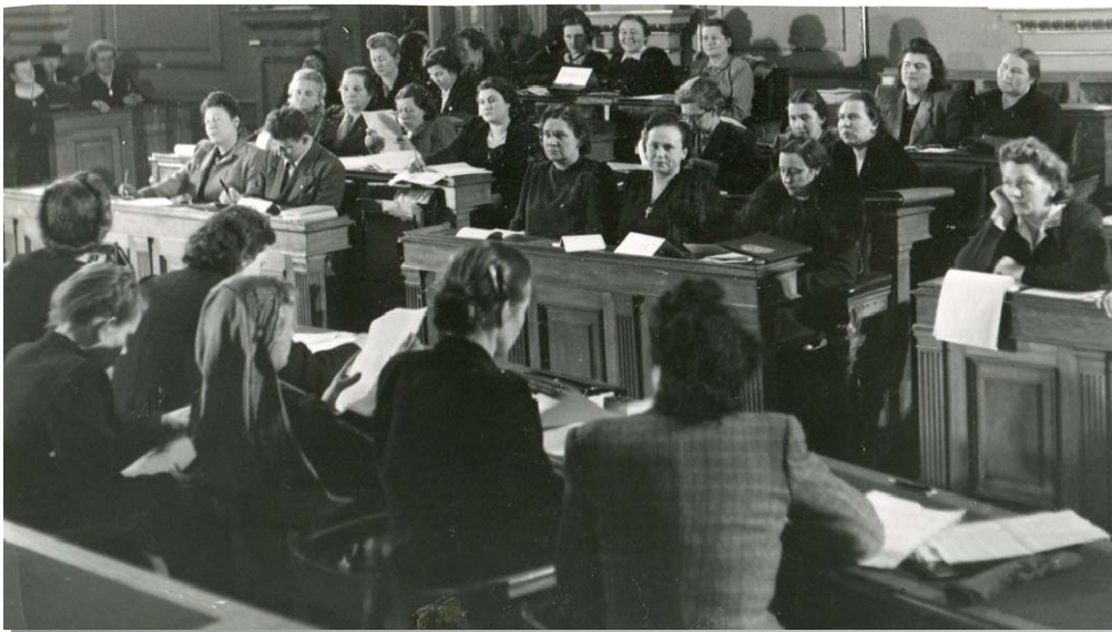
1947 рік. Прага. Засідання виконкому МДФЖ