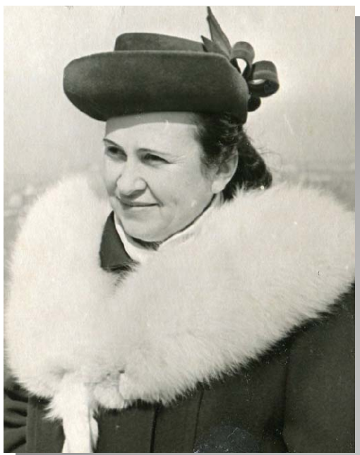
1957 рік. Ректор КДПІ імені О. М. Горького

З Монголії у вересні 1957 року на зустріч із колективом інституту приїхав голова спілки письменників Цендійн, який познайомив студентів-філологів з творами видатних монгольських письменників, прочитав твори, залишив свій автограф на збірці творів монгольських письменників. Того ж року пройшла зустріч викладачів і співробітників інституту з англійським вченим, керівником кафедри порівняльної педагогіки, професором Лондонського університету Джозефом Лаурисом, який прочитав для студентів і викладачів лекцію на тему "Система освіти Англії і Уельса і нові течії в цій системі".