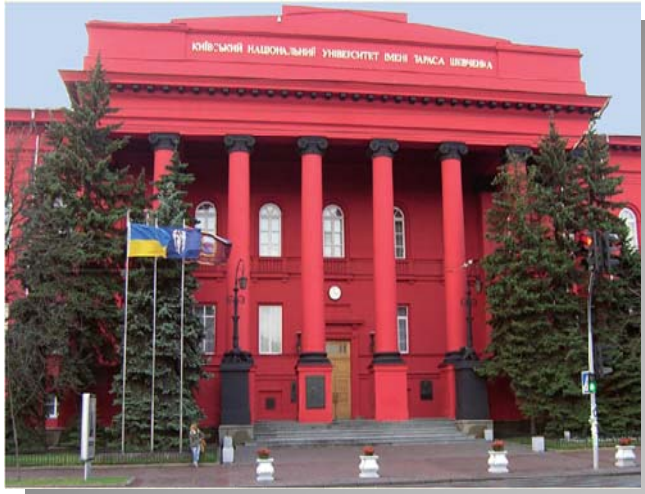
КДУ імені Тараса Шевченка