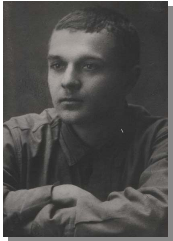
1927-1929 рр. Червоноармієць 225 стріл. полку

1927-1929 рр. – червоноармієць 225 стрілецького полку, з 1928 – член КП(б)У. В армії навчався на курсах підготовки до вузу і в 1929 р. став студентом факультету політосвіти Харківського інституту професійної освіти, реорганізованого згодом у Всеукраїнський інститут комуністичної освіти. Ще студентом бібліотечного факультету з 1930 по 1933 рік працював завідувачем Центрального бібліотечно-книжкового колектору НКО.