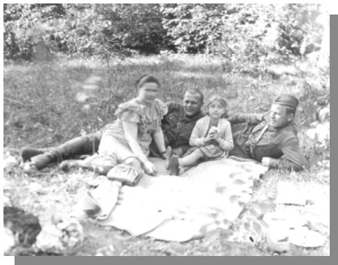
1939 р. На сімейному відпочинку

Згодом він – директор Центральної міської бібліотеки (1936-1938 рр.). Паралельно він викладав західноєвропейську літературу у Луганському педінституті ім. Т. Г. Шевченка.