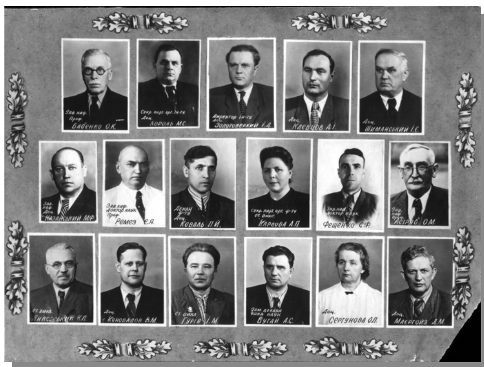
1954 р. Семінар директорів.

Зміни, що сталися за період його директорства добре викладені в Історичному нарисі, присвяченому ювілею Національного педагогічного університету ім. М. П. Драгоманова, що вийшов у 2000 році.