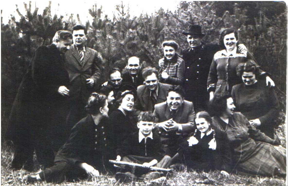
Травень 1954 р., зустріч із земляками

На посаді директора КДПІ ім. О. М. Горького, як і на попередніх етапах своєї діяльності, він наполегливо, доводить всім, що першоосновою в Україні повинні бути освіта і наука, завданням яких підпорядковані інші закони життя.