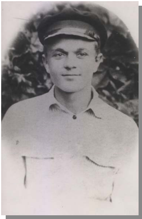
1923 р. Вихователь дитбудинку