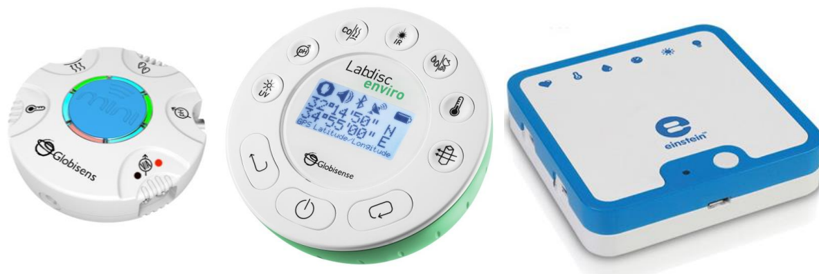
Рис. 4. Реєстратори даних.

Автор статті в рамках проекту Всеізраїльського центру вчителів природничих наук середніх класів долучилась до розробки складових науково-методичної системи розвитку дослідницьких умінь учнів та формування інформатичних компетентностей вчителів природничих наук у середніх класах шкіл Ізраїлю з використанням комп'ютеризованих лабораторій у навчанні.