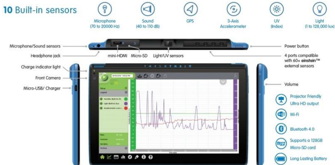
Рис. 2. Планшет з вбудованими датчиками. ( http://www.fourieredu.cz/en/category/21-einstein-tablet )

Цифрова лабораторія може бути представлена у вигляді планшета на базі ОС Android з відповідним програмним забезпеченням для управління експериментом і опрацювання даних та інтегрованими в корпус вимірювальними приладами (Рис. 2).