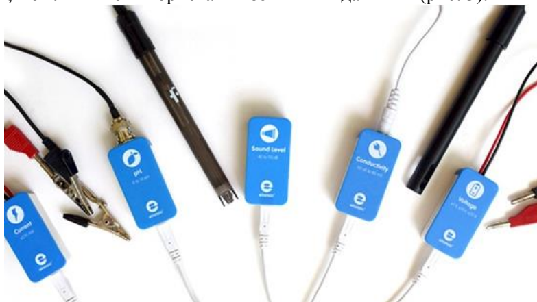
Рис.3. Зовнішні датчики. ( http://einsteinworld.com/he/product-category/sensors-he/ )

Крім вбудованих, можливим є використання зовнішніх датчиків (рис. 3).