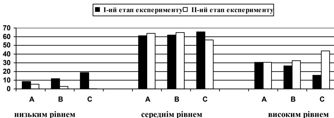
Рис. 2. Діаграма співвідношення кількості студентів у групах А, В, С із різними рівнями національної самосвідомості

Ефективність впровадження запропонованої нами методики видно при порівнянні співвідношення кількості студентів із різним рівнем національної самосвідомості у групах В і С.