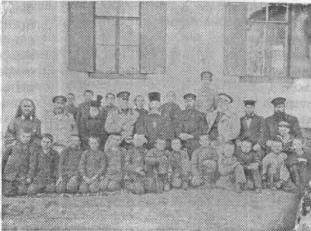
Сільська школа початку XX ст.