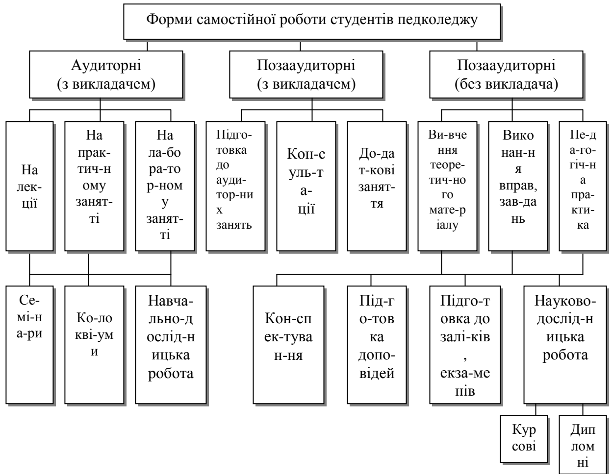
Рис. 1. Форми самостійної роботи студентів у педколеджі

Для ефективної організації самостійної роботи студентів в аудиторний і позааудиторний час було розроблено відповідну систему типових завдань з української мови та обраної спеціальності для студентів (рис. 2).