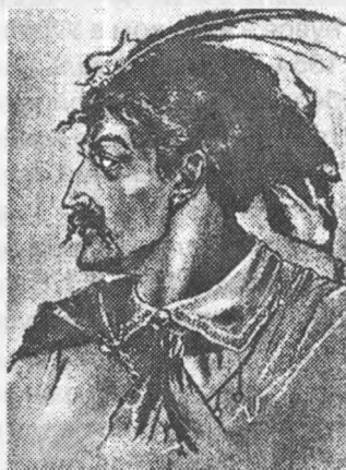
Гравюра польського художника Яна Матеєвського (Іван Богун)

Портрет було створено 1884 року. Він призначався переважно польському глядачеві. Художник прагнув розповісти правду про свого героя, утвердити правильний, неупереджений погляд польської громадськості на героя Національно-визвольної війни українського народу 1648–1654 років.