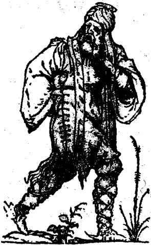
Татарин. Гравюра XVI ст.

дискос і потір із св. Софії надіслав у дврунок Іванові III» — М. Грушевський, т. IV, С. 326.