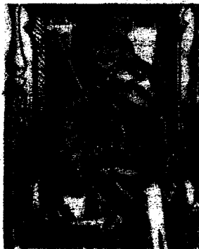
Олександр, король і Великий князь

1501 р. помирає польський король Ян Ольбрахт, і престол без боротьби забирає Олександр за умови, що « Корона Польщі і Великого Князівства Литовського злучається в одно неподільне і одностайне тіло, щоб був один народ, одна нація, одне братство, спільна рада,