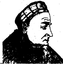
Сигізмунд I Старий

го князівства. У серпні 1506 р. Олександр помер. Новий Великий князь Московський Василь III звернувся до Олени з проханням допомогти йому в обранні його на литовський престол, але спізнився, бо вже був обраний Сигізмунд. Так білоруська та українська людність Великого князівства опинилася в скрутному становищі. З одного боку, їй загрожувала латинізація і спольщення, а з другого — наступало православне Московське князівство, яке поки що обіцяло рівноправність.