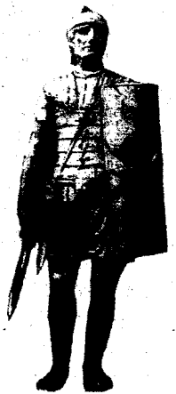
Легіонер: опертя і острах Імперії

Так закінчилося життя і правління кривавого чудовиська, яким був Нерон. Навіть скульптурний портрет імператора всім своїм виглядом викриває його підозрілість, неврівноваженість, підступність. Про жорстокі вади цієї людини свідчить його важкий погляд та міцно затиснуті губи.