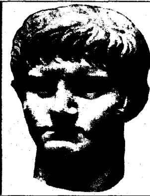
Імператор Нерон — актор на троні