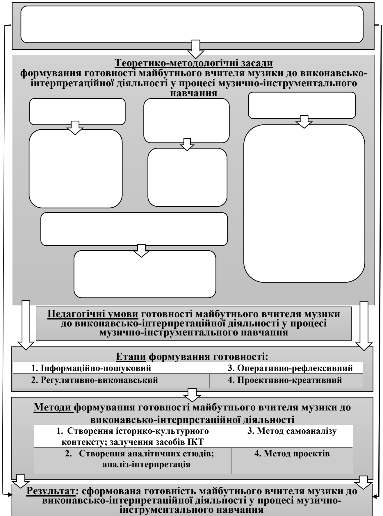
Рис. 1. Модель формування готовності майбутнього вчителя музики до виконавсько-інтерпретаційної діяльності у процесі музично-інструментального навчання