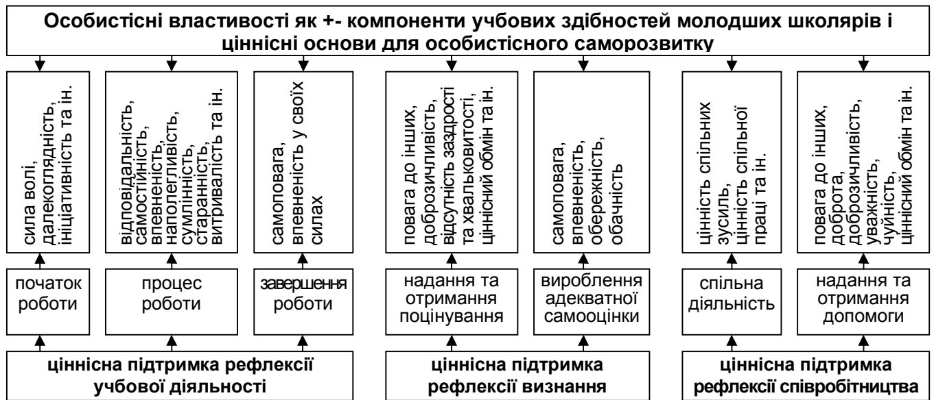
Рис. 2. Напрямки ціннісної підтримки регуляції розвитку учбових здібностей молодших школярів

продовження і позитивного підкріплення успішного завершення чи винесення уроків із невдач); 2) для рефлексії потреби в визнанні (вербалізація та усвідомлення прийомів надання й отримання поцінування); 3) для підтримки рефлексії співробітництва (мотивування до спільної діяльності та ціннісного обміну). Порівняння отриманих у констатувальній частині дослідження показників успішних та неуспішних учнів дозволяють висунути припущення про те, що результатом ціннісної підтримки мають стати особистісні якості, які усвідомлюються й розвиваються в їх співвідношенні з індивідуальними досягненнями в учбовій діяльності (рис. 2).