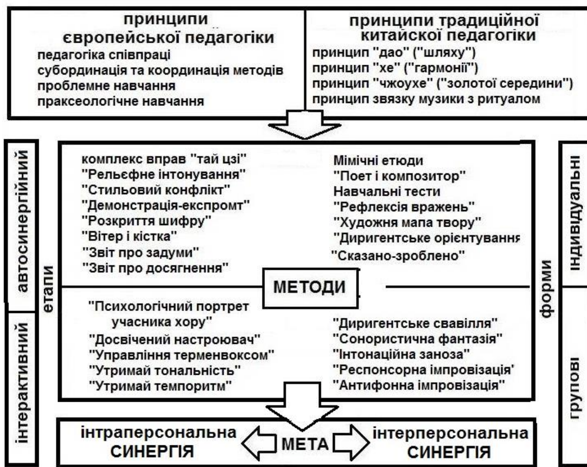
Рис. 1. Загальна схема методики формування здатності вчителя музики до керування хором

3) Музично-когнітивний критерій. Показники: детальність і точність інтонаційного уявлення музичної форми твору та її елементів; міра стійкості інтонаційного уявлення форми; міра пластичності уявного інтонаційного образу твору. Ступінь сформованості за даним критерієм встановлюється шляхом тестування та експертної оцінки виконаних студентом завдань.