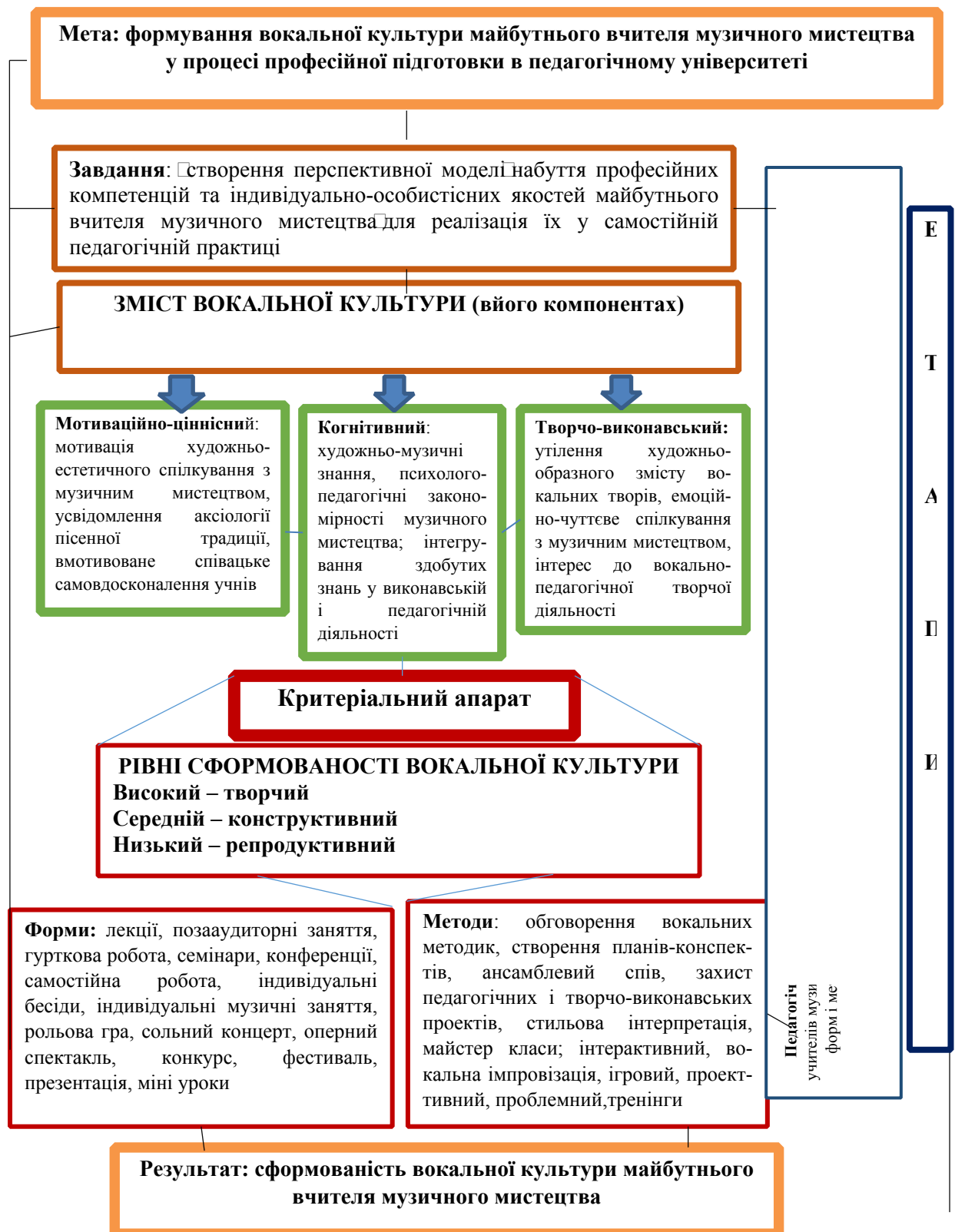
Рис. 1. Організаційно-методична модель формування вокальної культури майбутніх учителів музичного мистецтва емоційно-ціннісну

Для проведення експериментальної роботи розроблено комплекс критеріїв та їх показників для оцінки успіхів у формуванні вокальної культури учителів музичного мистецтва, що узгоджувались із визначеними структурними компонентами вокальної культури: