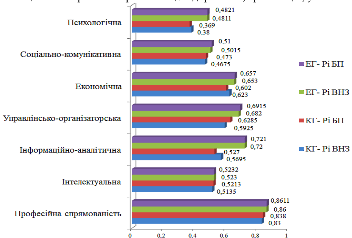
Рис. 2. Показники рівнів сформованості груп професійно значущих якостей студентів контрольної та експериментальної груп за оцінками викладачів ВНЗ та керівників практики від підприємств

Порівняльний аналіз інтегральних показників рівня сформованості професійно значущих якостей контрольної ( КТ ), експериментальної ( ЕГ ) груп наведені на рис. 2, де: Pi ВНЗ – показник рівня сформованості груп професійно значущих якостей за оцінками викладачів ВНЗ; Pi БП – показник рівня сформованості груп професійно значущих якостей за оцінками керівників практики від підприємств, організацій, установ.