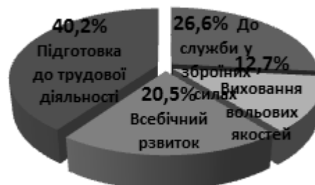
Рис. 2. Результати опитування студентів I курсу щодо ролі фізичної культури у їхньому житті.

За даними результатів дослідження встановлено, що одним з показників орієнтації на фізичне вдосконалення можна вважати наявність інтересу студентів до спортивного життя, де 63% респондентів вказали, що вони читають спортивні газети, спортивну літературу, дивляться спортивні передачі, виявляють увагу до спортивних подій університету, країни. Експериментально з'ясовано, що джерелами інформації в області фізичної культури для студентів є телебачення і радіо 42,4%; книги, журнали і газети 31,8%; 15,5 % студентів вважають, що основними джерелами знання для них з'явилися практичні заняття з фізичного виховання і тільки 10,3% студентів відзначають значимість лекцій з фізичного виховання. Результати опитування студентів I курсів (Рис. 2) показали, що головним на заняттях з фізичної культури студенти вважають досягнення всебічного розвитку 20,5%, підготовку до трудової діяльності 40,2%, захисту Батьківщини 26,6%, виховання вольових якостей 12,7%.