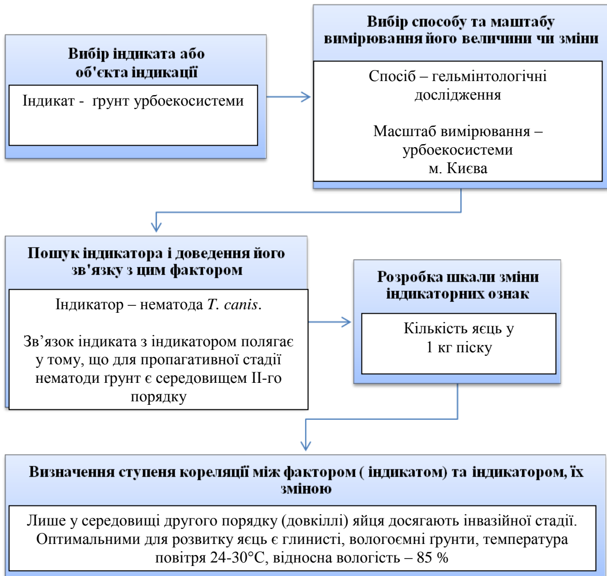
Рис. 2 Схема біоіндикації паразитарного забруднення в урбоекосистемі з використанням Toxocara canis .

Поширенню токсокарозу серед собак сприяє досконалий еволюційно сформований механізм передачі збудника. Інвазування хазяїв відбувається перорально за допомогою трансплацентарного або трансмамарного шляхів зараження.