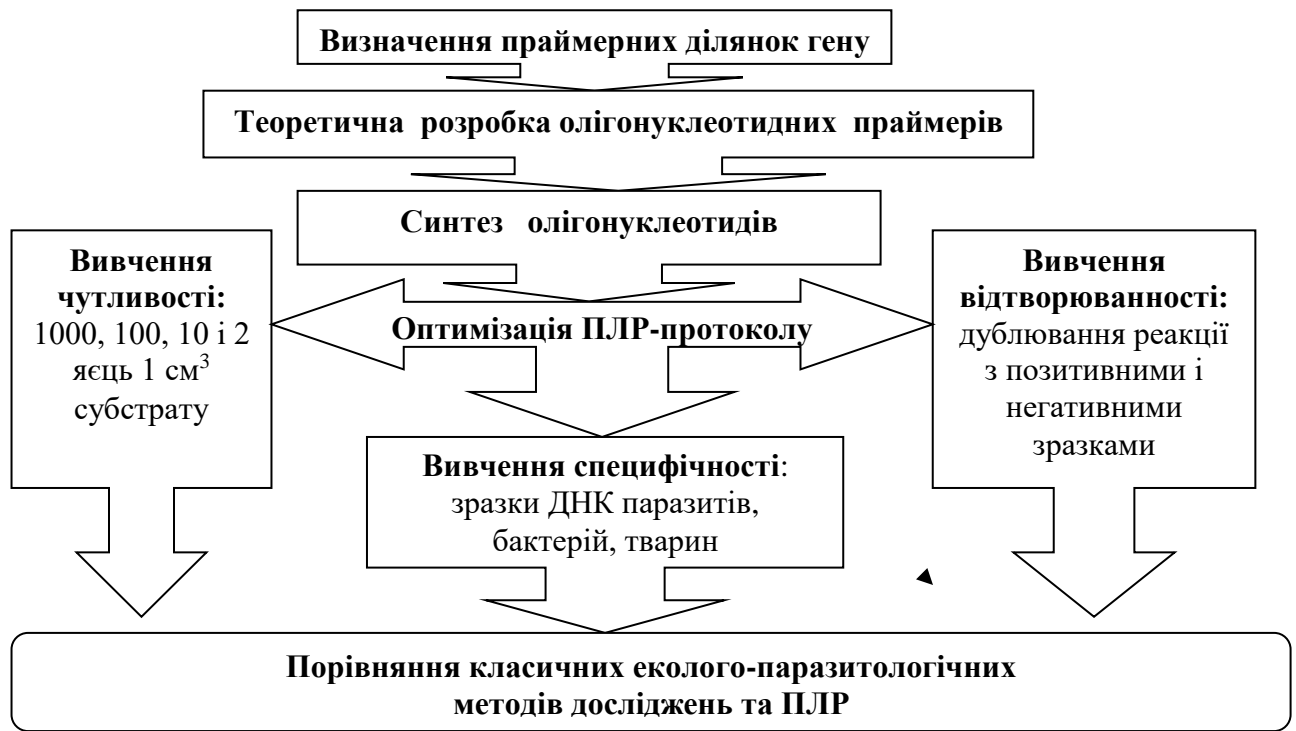
Рис. 1. Схема розробки способу детекції у доквіллі аскаридідозів домашніх хижаків з використанням полімеразні ланцюгової реакції

Теоретичну розробку олігонуклеотидних праймерів проводили за допомогою електронних баз даних GenBank, EMBL, Entrez та DDBJ; комп'ютерних програм Vector NTI Suite, Align X, FASTA та BLASTA on line. Синтез олігонуклеотидів на наше замовлення здійснювала Науково-виробнича фірма «Литех» м. Москва.