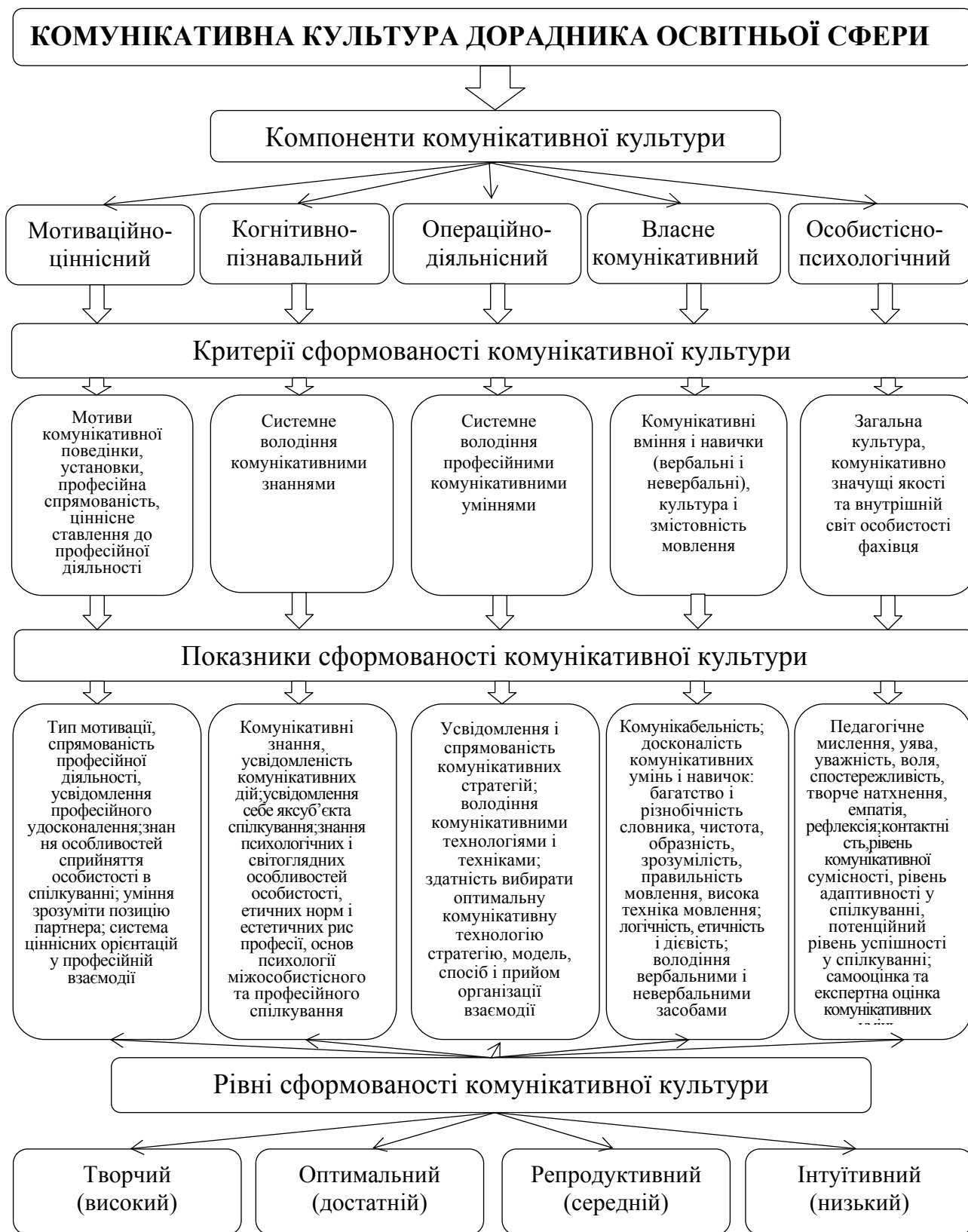
Рис. 2. Структура комунікативної культури дорадника освітньої сфери