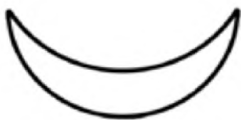
Мал. 2. Зображення символічного знаку «Аллат»