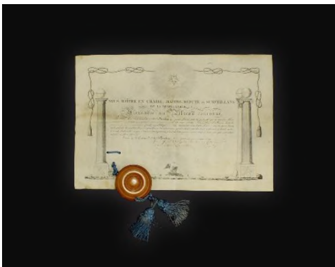
Фото 01. Грамота масонської ложі «Олександра благодійності до коронованого пелікану». 1817р. С-Петербург.