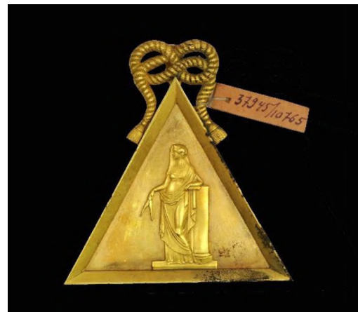
Фото 03. Знак-підвіска масонської ложі «Астрейя». Поч. XIXст. С-Петербург.