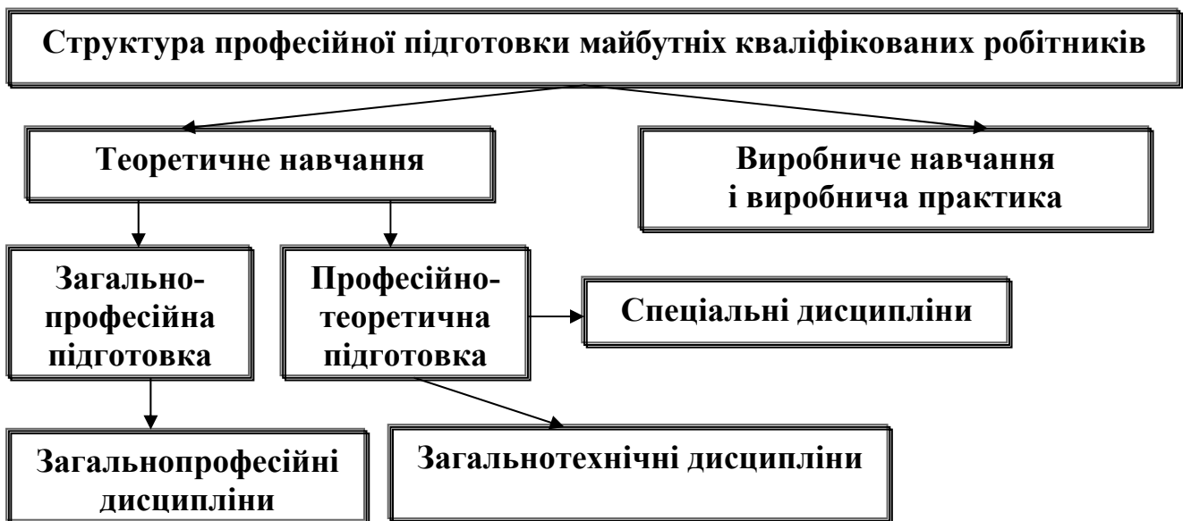
Рис. 1. Зміст професійної підготовки майбутніх кваліфікованих робітників на базі повної загальної середньої освіти у технічних училищах

З урахуванням результатів здійсненого аналізу можна констатувати, що основними чинниками, що впливали на цей процес, були: зміст професійної освіти, який визначається суспільними вимогами щодо їх підготовки системою ПТО, що знаходить відображення в кваліфікаційних характеристиках спеціальностей (склалися відповідно до ЄТКД; відображали сучасний розвиток науки, техніки та технології певної галузі виробництва), і структурний аналіз змісту їх професійної підготовки; цей процес складався з двох основних етапів: 1) відбору змісту та укладення структури навчальних планів; 2) відбору і структурування змісту навчальних програм дисциплін, що входили до навчальних планів. Структурний аналіз змісту професійного навчання майбутніх кваліфікованих робітників на базі повної загальної середньої освіти здійснювався відповідно до концептуальних засад щодо відбору і структурування змісту професійної підготовки, обґрунтованих С. Батишевим. В ньому можна виокремити такі етапи: 1) відбір навчальних планів ТУ за певним галузевим виробництвом; 2) аналіз змісту професійного навчання майбутніх кваліфікованих робітників (рис. 1); 3) відбір і структурування змісту предметних блоків у навчальних планах ТУ (рис. 2); 4) відбір і структурування змісту навчальних програм ТУ.