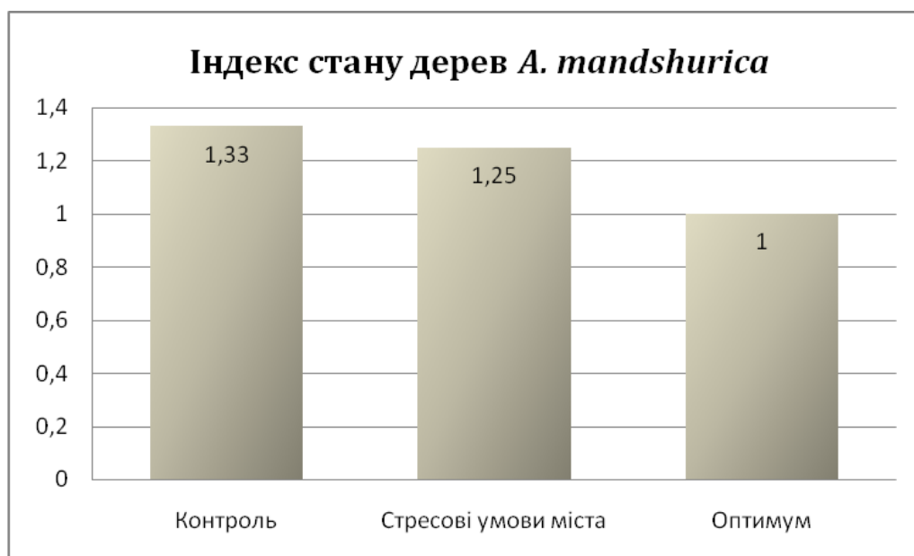
Рис. 3. Індекс деревостану абрикосів A. mandshurica в антропогенно забруднених умовах зростання.