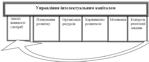
Рис. 2. Процес управління інтелектуальним капіталом

За В. Липчук та Т. Липчук [5] процес управління інтелектуальним капіталом включає шість етапів (рис. 2).