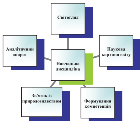
Рис. 4. Модель навчальної дисципліни

Проаналізуємо запропоновану модель. Як бачимо з Рис. 4 навчальна дисципліна має сприяти становленню особистості та її світогляду, формувати компетенцій, зокрема соціально особистісні. Має розширювати уявлення студентів про наукову картину світу. Оскільки мова йде про гуманітарну дисципліну (саме вони в більшій мірі забезпечать формування вищезгаданих компетенцій), тому вона має відображати її зв'язок з комплексом природничих, фізико-математичних дисциплін. Звісно, ця дисципліна має слугувати аналітичним апаратом для студентів, щоб набуті ними знання розширювали межі їх свідомості. Така дисципліна повинна слугувати лакмусом, нагадуванням про те, що наука не вершиться сама по собі, експеримент не відбувається без дій людини, і саме вона має нести відповідальність за їх результат.