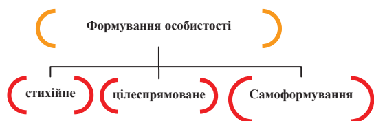
Рис. 1. Види формування особистості

Процес формування особистості залежить від багатьох чинників, зокрема, від спадковості, виховання людини, середовища в якому вона знаходиться, ну й звичайно її розвиток відбувається в процесі діяльності яку вона виконує. Розрізняють три види розвитку і формування особистості (Рис 1) [5, с. 45].