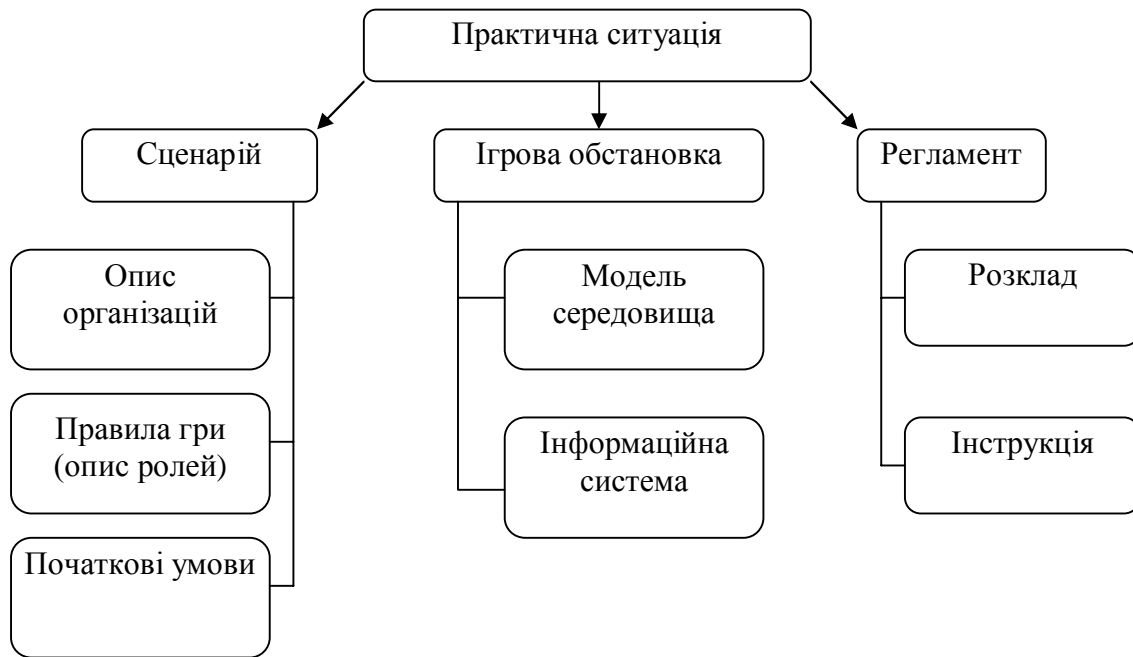
Рис. 4. Фрагмент функціональної структури управлінської імітаційної гри