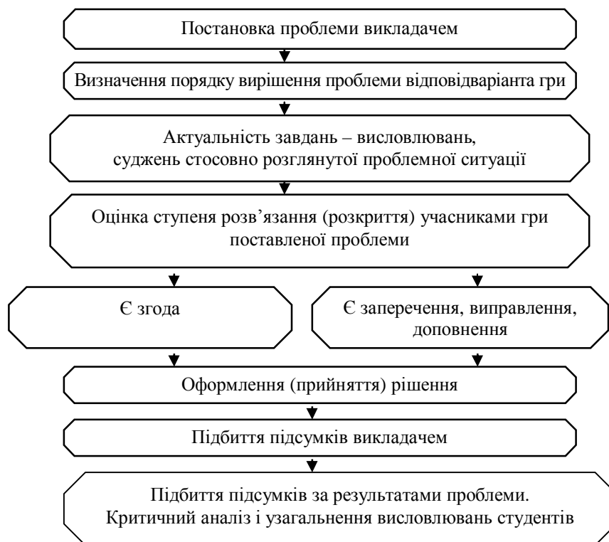
Рис. 3. Схема організації рольової гри як дидактичної форми професійної підготовки спеціалістів з обліку і аудиту

Особливе значення в процесі організації рольових ігор на заняття з управлінського обліку мають так звані когнітивно-ігрові прийоми, спрямовані на розвиток і вдосконалювання пізнавальних процесів. До таких прийомів включають: