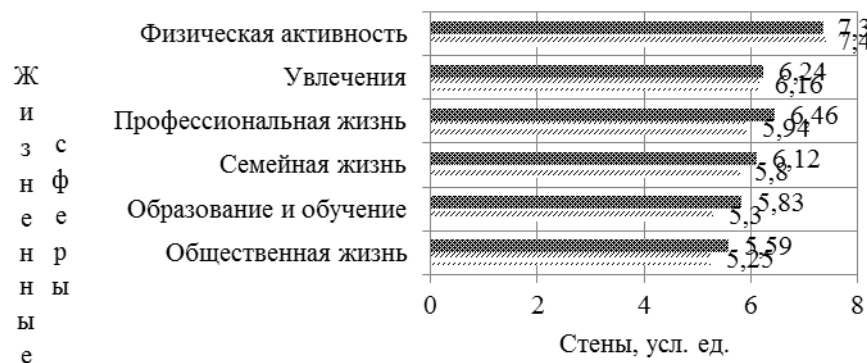
Рис. 4. Показатели жизненных сфер в зависимости от гендерной принадлежности [штрихованный] - женщины, [точечный] - мужчины.

Анализируя проявление жизненных сфер у мужчин и женщин можно сказать, что они повторяют профиль ценностных ориентаций (рис. 4). Жизненные сферы у женщин более выражены, чем у мужчин, в частности сфера профессиональной жизни. Возможно, это связано с тем, что в последнее десятилетие женщины часто занимаются так называемой «мужской» работой – управляют крупными компаниями, становятся во главе правительств [5]. Спорт – это такая деятельность, которая требует не только целеустремленности, но и определенной доли агрессии от женщины, для того чтобы добиться желаемого результата. Конкуренция, которая очень высока как в жизни, так и в спорте, также является сильнейшим стимулом для плодотворной работы.