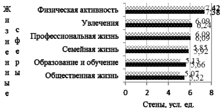
Рис. 2. Показатели жизненных сфер у спортсменов разной квалификации [ ] - МС и выше; [ ] - КМС и ниже.

Сравнивая показатели, которые мы получили в результате нашего исследования у спортсменов с учетом гендерных различий, можно отметить практически идентичные показатели по всем жизненным сферам (рис. 2). Следует обратить внимание на то, что показатели сфер образования, обучения и общественная жизнь выше у спортсменов, имеющих квалификацию КМС и ниже, чем у мастеров спорта и выше. Видимо, это связано с тем, что эти спортсмены тратят свое время не только на спортивное совершенствование, но и на другие сферы жизни, такие как образование и общественная жизнь.