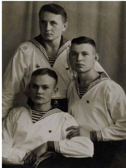
1958 р. З друзями