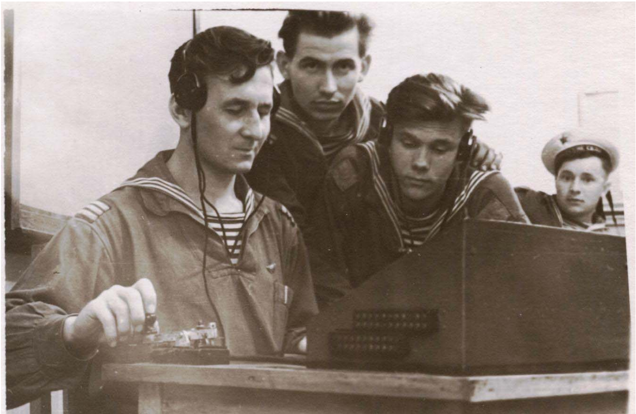
1958 р. На заняттях з радіотехніки у навчальному підрозділі