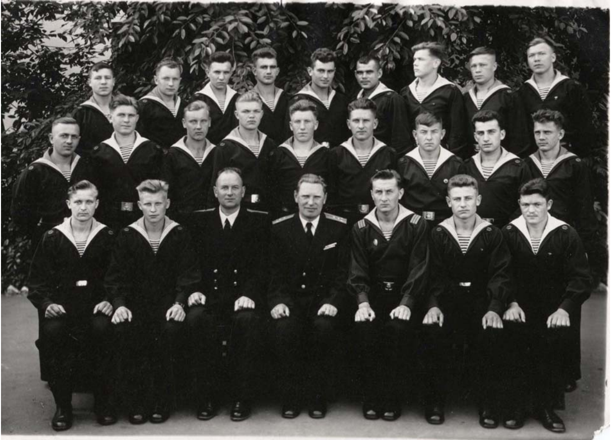
1958 р. Бойовий склад військового крейсера в/ч 20884