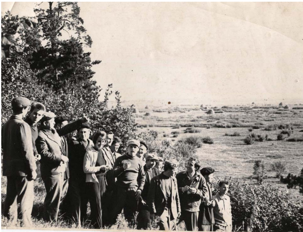
1962 р. Зі студентами фізико-математичного факультету на базі відпочинку у спорттаборі інституту "Берізка" на території майбутнього Київського водосховища