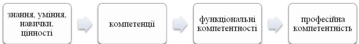
Рис. 1. Загальна структура професійної компетентності фахівця

У науково-літературних джерелах [4,7] загальна структура професійної компетентності фахівця подана таким чином (рис. 1):