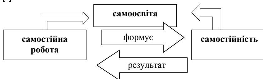
Рис. 2. Взаємозв'язок понять “самостійна робота”, “самостійність” та “самоосвіта”

Самостійна робота виступає передумовою самоосвіти, так за визначенням С. У. Гончаренка “самоосвіта – це освіта, яку отримують у процесі самостійної роботи без проходження систематичного курсу навчання в стаціонарному навчальному закладі. Крім того самоосвіта, є невідомою частиною систематичного навчання в стаціонарних закладах, сприяє поглибленню, розширенню та більш міцному засвоєнню знань” [6].