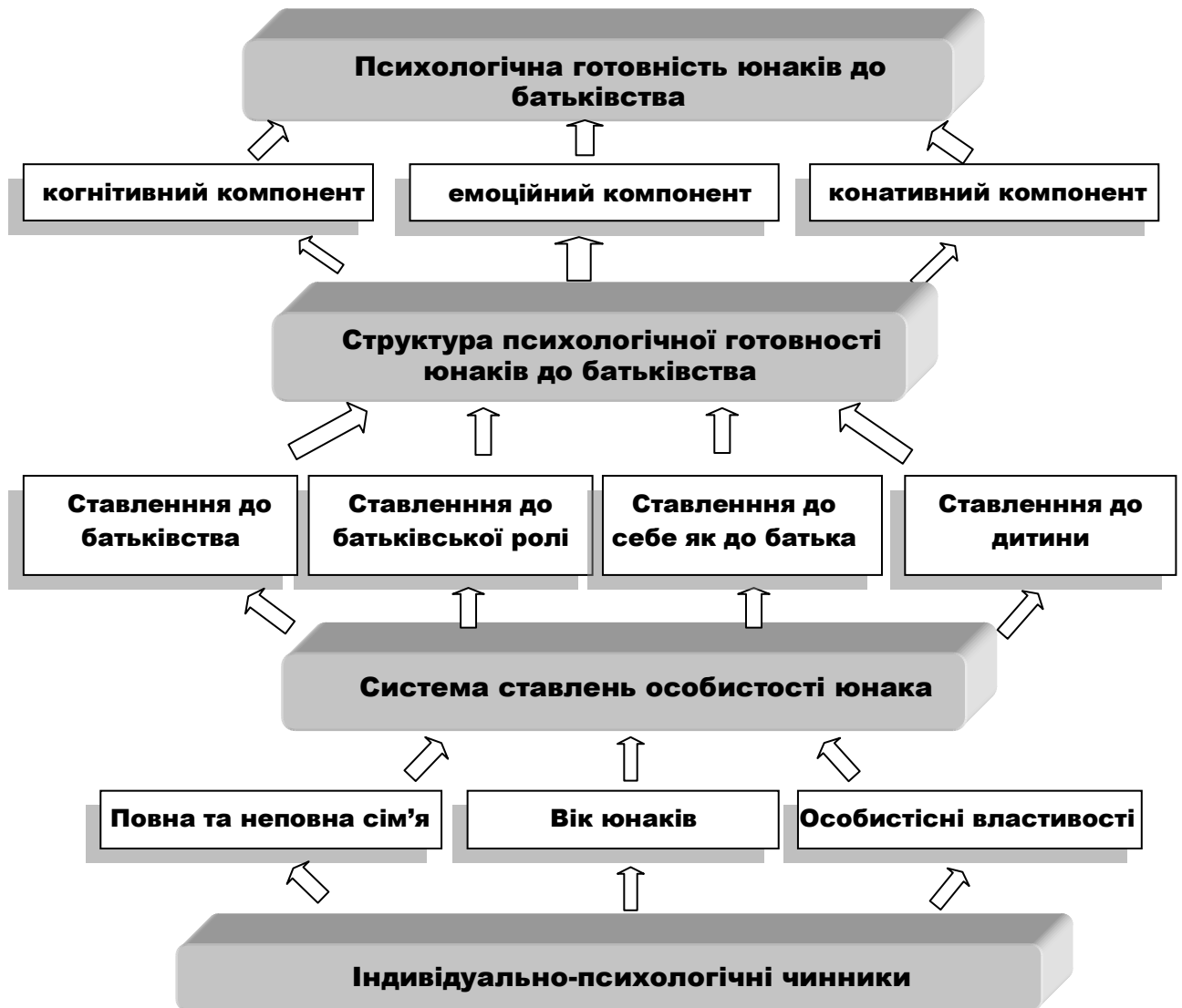
Рис. 1 Модель психологічної готовності юнаків до батьківства

У третьому розділі – «Психологічний супровід формування психологічної готовності юнаків до батьківства» – обґрунтовано та презентовано програму розвитку психологічної готовності юнаків до батьківства; проаналізовано результати зростання якісних показників психологічної готовності юнаків до батьківства у кожній віковій групі досліджуваних експериментальної та контрольної груп; розроблено методичні рекомендації практичним психологам та класним керівникам щодо підвищення психологічної готовності юнаків до батьківства.