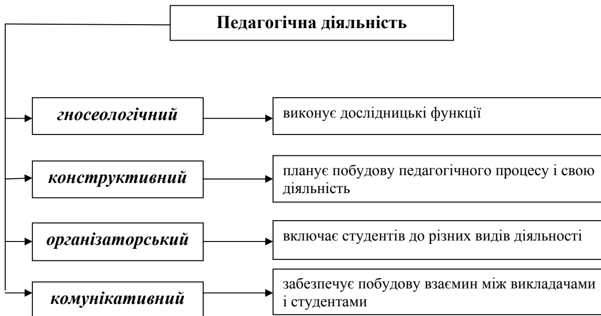
Рис. 1. Структурні компоненти педагогічної діяльності (за В. Сластьоніним)

Згідно з системно-структурним підходом, педагогічна діяльність, як різновид людської, має свою структуру, компоненти, які екстраполюючись на процес професійної підготовки, характеризують змістову сторону навчання. У педагогічній діяльності сучасні науковці виділяють низку структурних компонентів: