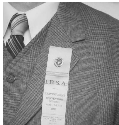
Рис. 4. Емблема хреста в короні [24, с. 103–104]

Однак у другій половині 1920-рр цей символ Джозеф Рутерфорд, наступник Чарльза Рассела у керівництві Товариства Вартової Башти, почав розглядати як ознаку Вавилону, відступницької релігійної системи. Повідомляється, що на конгресі Дослідників Біблії 1928 року у Детройті, штат Мічиган, було оголошено носіння символу хреста і корони непотрібним та навіть небажаним. У тому ж році було зроблено акцент на тому, що відмітною рисою приналежності до християнської віри повинен бути не “декоративний символ”, а участь у служінні проповіді [10, с. 200]. Значки “Хрест і корона” у різних варіантах пропонувалися для придбання на сторінках журналу “Вартова башта” до 1928 року, однак у наступні роки така пропозиція більше не з’являлася на його сторінках [11]. Навіть більше, починаючи з 15 жовтня 1931 року, номери Вартової Башти не містили знаку хреста і корони на своїй титульній сторінці.