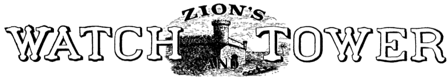
Рис. 1 Вигляд символу вежі у журналі “Вартова башта” у перші десятиліття випуску журналу

та пастухи отар. Окрім того, вони слугували в якості тимчасового житла для тих, хто перебував на досить далекій відстані від власних домівок [7; 15, с. 509].