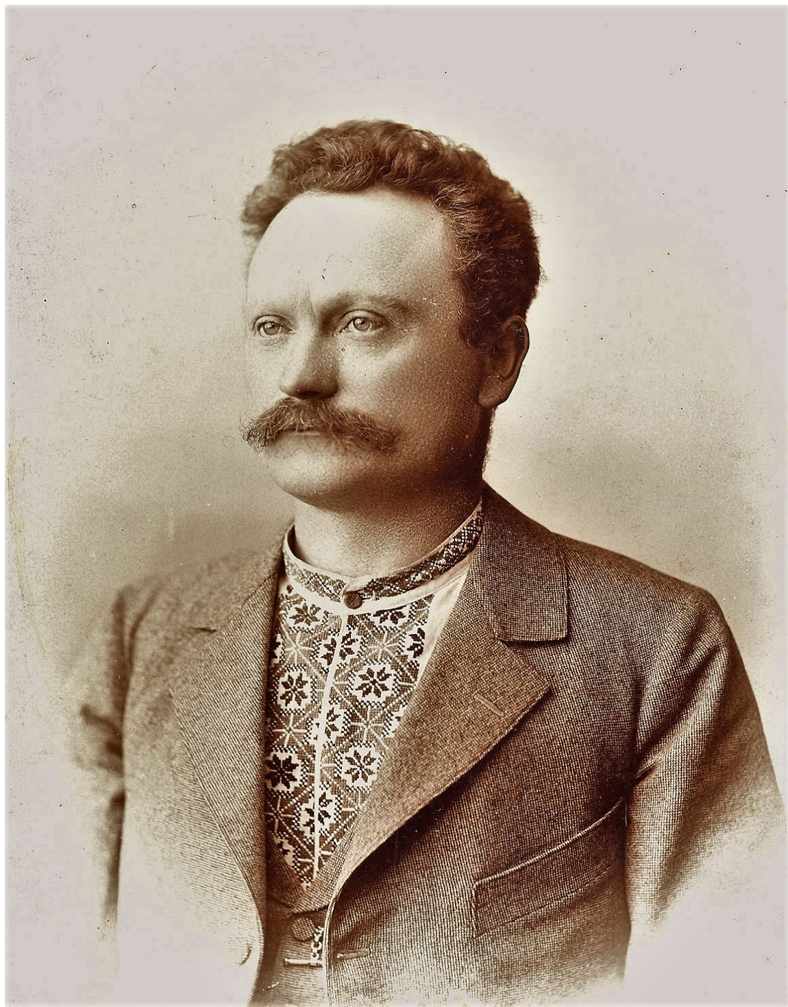
Іван Франко. 1898 рік.