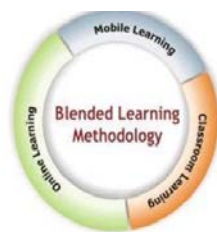
Рис. 3. Комбіноване навчання = Традиційне + Дистанційне + Електронне + Мобільне навчання

На думку А.Хейнце та К.Проктера, сутність застосування комбінованих технологій можна зобразити наступним чином [7], що зокрема відображено на рис. 3: