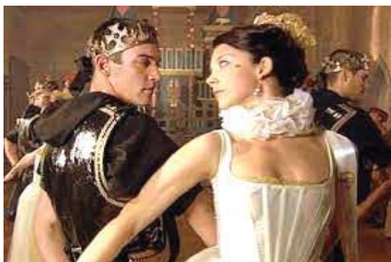
Мал. 6 «Тюдори», 2007 [16]

Дійство розпочалося з появи восьми лордів (серед них був і король Генрі VIII), одягнених у блакитний атлас і золоту тканину, які представляли чесноти притаманні чоловікам: Любов, Шляхетність, Молодість, Турбота, Вірність, Люб'язність, Добро і Свобода [15].