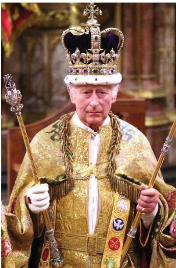
Мал 3 Коронація Чарльза III 6 травня 2023.

Життя великій королеві Англії дала Анна Болейн, яка була коронована як королева-консорт 1 червня 1533 р., короною Святого Едуарда [11], якою коронуються тільки королі і королеви, Анна Болейн стала єдиною за 1000-літню історію коронації у Великій Британії коронованою короною Св. Едуарда. Це був її найбільший триумф, але королевою вона пробула тільки тисячу днів (страчена в Тауері 19 травня 1536 р.).