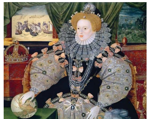
Мал. 4 The Armada Portrait of Queen Elizabeth I, c. 1588.

Після смерті батька Генрі VII (1509), трон успадковує саме Генрі VIII, бо його старший 15-річний брат Артур Принц Уельський, одружений на Катерині Арагонській (1485–1536), помер у 1502 р., і щоб не повертати частину приданого іспанському королю Фердинанду II за доньку та частину її вдовиного права доходів від Уельсу, англійський король Генрі VII