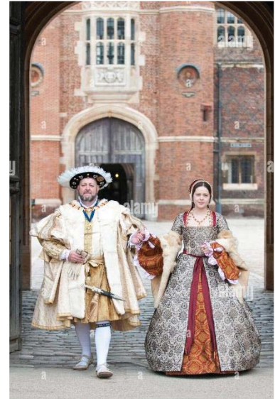
Мал. 10. Генрі й Анна, 2020.

Мора (1478–1535), англійського письменника, державного діяча, філософа, автора трактату «Утопія», який був лорд-канцлером Англії (1529–1532), якого ситуація з розлученням Генріха VIII, а потім несприйняття ним весілля короля з вагітною Анною Болейн 25 січня 1533 р., в кінцевому результаті привели до його падіння і страти в Тауері