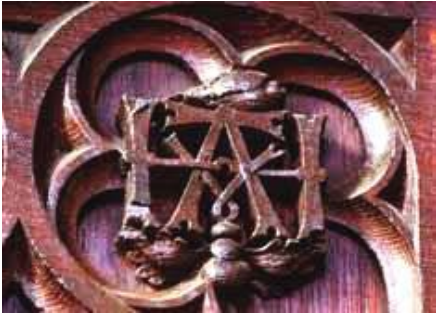
Мал. 11. Вензель «НА».

Після 1530 р. палац буде перебудовуватися, щоб догодити Анні Болейн (Мал. 10), яка дуже любила Гемптон корт, і повсюди в палаці, як знак великого кохання короля і Анни, будуть впадати в око їх переплетені вензеля «НА» (Henry and Anna) (Мал. 11), до речі, на стелі Великої зали вони збереглися досі, хоча після страти Анни у 1536 р. король наказав знищити все, що було пов'язано з «коханням його життя», але деякі артефакти збереглися.