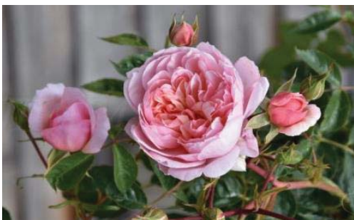
Мал. 1 Троянда «Анна Болейн», 1999.

Залучаючи студентів до науково-дослідницької діяльності, стимулюючи їх творчість і критичне мислення у процесі вивчення іноземної мови за професійним спрямуванням в умовах університету, як-от: дослідження троянди «Анна Болейн» (Мал. 1), названої на честь другої дружини короля Англії Генріха VIII (Мал. 2), ми «пирнули» в транскультурний вир, який стимулює формування у студентів трансверсальних компетентностей, що дозволяють студентам-біологам переносити набуті знання, навички та когнітивні здібності у професійну діяльність [5; 10; 11; 12; 13; 14].