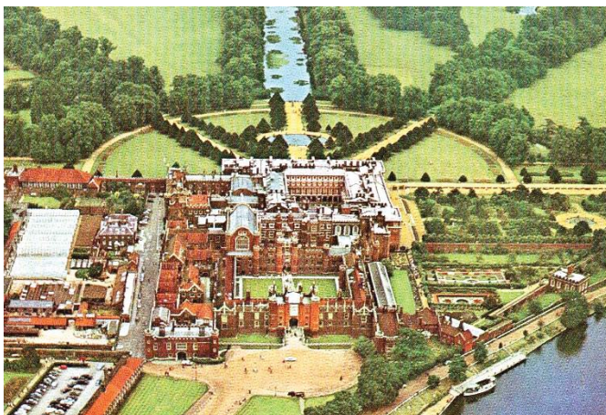
Мал. 7 Гемптон корт палац, Лондон

Генріх починає процедуру анулювання шлюбу з Катериною з 1525 р. Це було нечувано! Перемовини з Римом у цій делікатній справі вів кардинал Томас Уолсі, але безуспішно. Він впав в немилість короля і, щоб залишитися живим і при владі, вимушений був подарувати Гемптон корт палац в Лондоні (Hampton Court Palace), який вражав своєю архітектурою, розкішшю і розмахом (у короля такого не було) (Мал. 9).