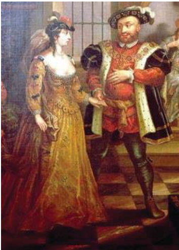
Мал. 2 Анна Болейн і Генрі VIII, пр. 1532. George Gower. Woburn Abbey, Bedfordshire, UK

Зрозуміло, що тезисно складно викласти весь напрацьований матеріал, але не порушуючи вимог до тез, конкретизуємо головне.