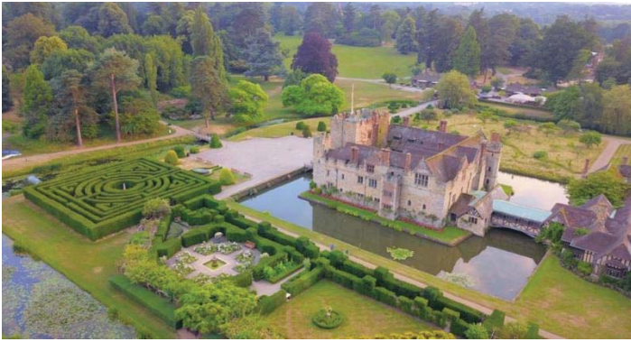
Мал. 7 Замок Хівер в графстві Кент (Англія).

На той час Анна була закохана і вже таємно заручилася з молодим лордом Генрі Персі у 1523 р., про що стало відомо королю. Заручини скасовують, Анна перебуває у безвихідному відчаї і кінець кінцем її відсилають до фамільного замку Хівер (Мал. 7) в графстві Кент (де вона пробуде до 1527 р., до свого повернення до двору фрейліною королеви Англії Катерини