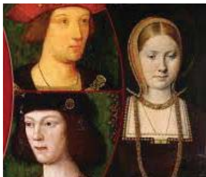
Мал. 5. Принц Артур, Генрі VIII, Катерина Арагонська.

Тож у 1509 р. Генрі VIII стає королем Англії і одружується на вдові свого покійного