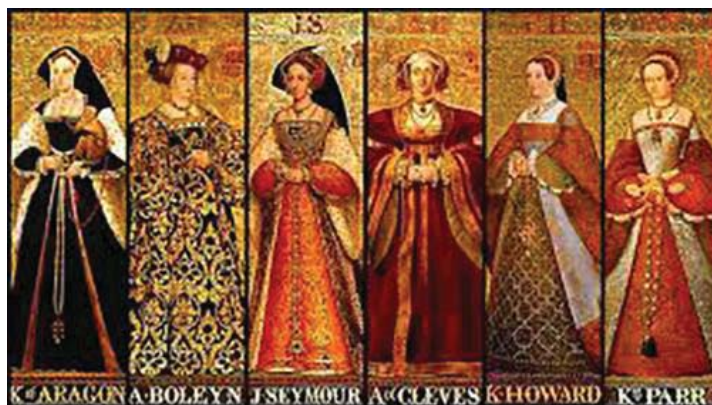
Мал. 13. Шість дружин короля Англії Генріха VIII.