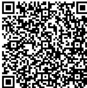
Рис. 1. QR-код покликання на відео-курс “Екопогляд: супутникові дані у дослідженні природи”

від першого по 12 класи. Загалом на конкурс з 2020 року зареєструвалися та пройшли навчання 1482 учасника. В конкурсі можуть брати участь як учні, які навчаються в секціях “ГІС та ДЗЗ” у територіальних відділеннях Малої академії наук України, так і учні, які самостійно опановують ці технології, для останніх ми розробили дистанційний курс на платформі Canvas [5], який складається з чотирьох модулів: “Знайомство з конкурсом та основами дистанційного зондування Землі”, “Використання онлайн ресурсу EO Browser для дешифрування та аналізу доступних космічних знімків”, “Знайомство з платформою супутникового моніторингу Землі - Giovanni NASA”, “Створення власного дослідницького проєкту”. Окрім того ми розробили 5 модулів відео-курсу за темою “Екопогляд: супутникові дані у дослідженні природи” для учасників конкурсу, де перший модуль присвячено теорії фізичних основ створення супутникових знімків, другий знайомить із функціоналом та можливостями сервісу Google Earth Pro, третій – EO Browser, четвертий - Giovanni NASA, пятий - NASA Worldview.