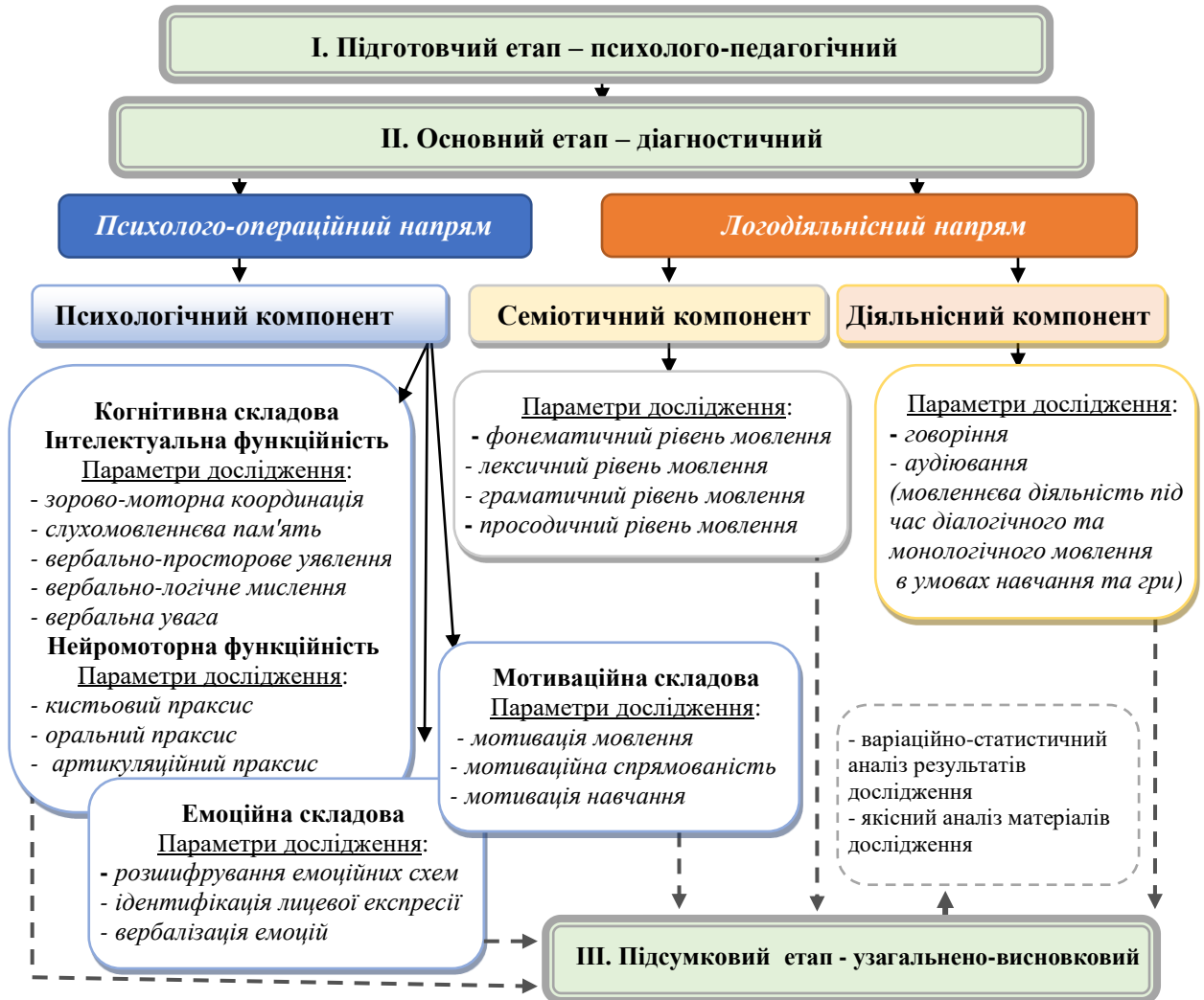
Рис. 2. Структурно-функційна модель вивчення мовленнєвої готовності

емпіричного дослідження, що дає можливість, з огляду на різноманітність підходів, вирішити завдання, поставлені в констатувальному експерименті, максимально результативно та повно (рис. 2).