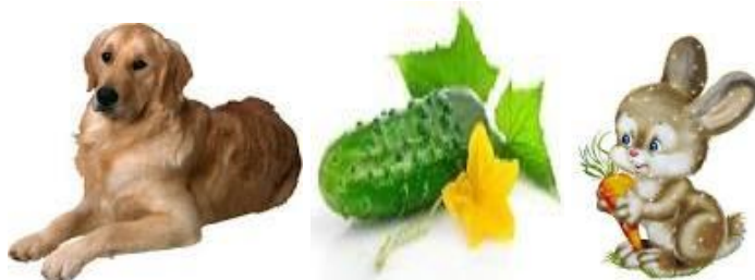
Бобака (собака) Охірок (огірок) Сайчик (зайчик)

3). Контроль за вимовою слів із замінами звуків, які змішуються (замінюються) в мовленні дитини, вимова, яка імітує неправильну вимову дитини: момоко (молоко), каха, кася (каша), тумка (сумка), сайчик (зайчик), чукор (цукор).