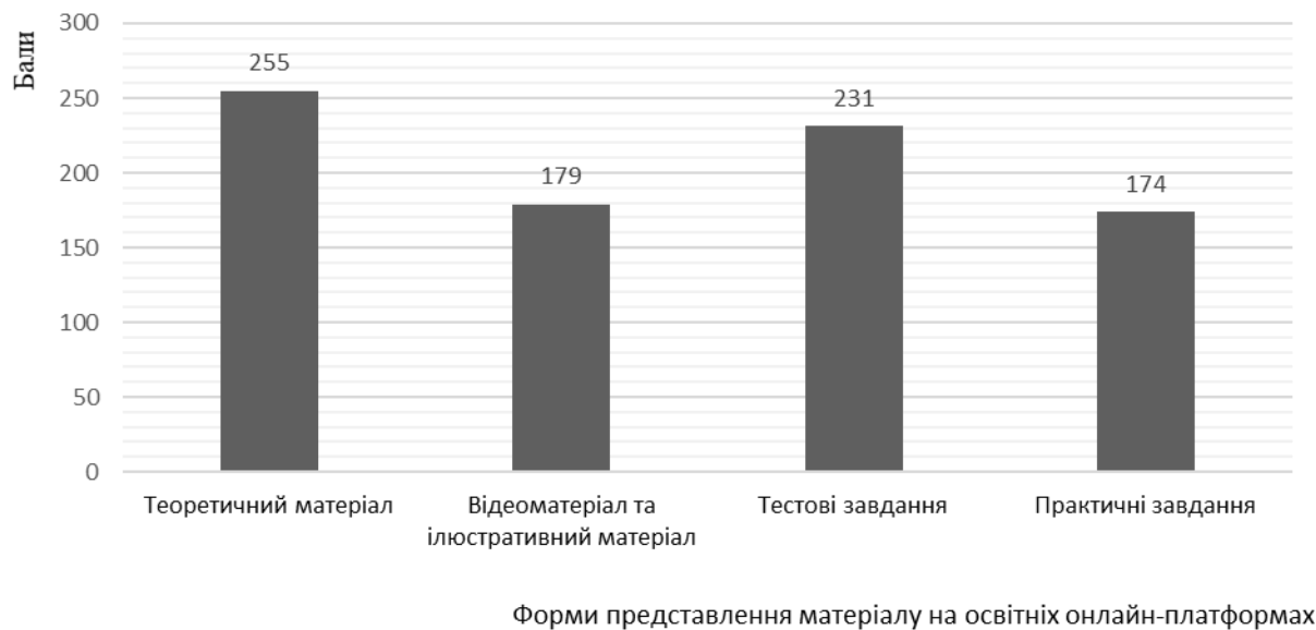
Рис. 3. Значущість форм представлення матеріалу, які доцільно використовувати при створенні освітніх онлайн-платформ, думка юних спортсменів (n=95).

Юні респонденти, в процесі проведеного опитування, також виділили переваги, які може отримати молодий футболіст, використовуючи освітній матеріал, розміщений на спеціалізованих онлайн платформах (рис. 4).