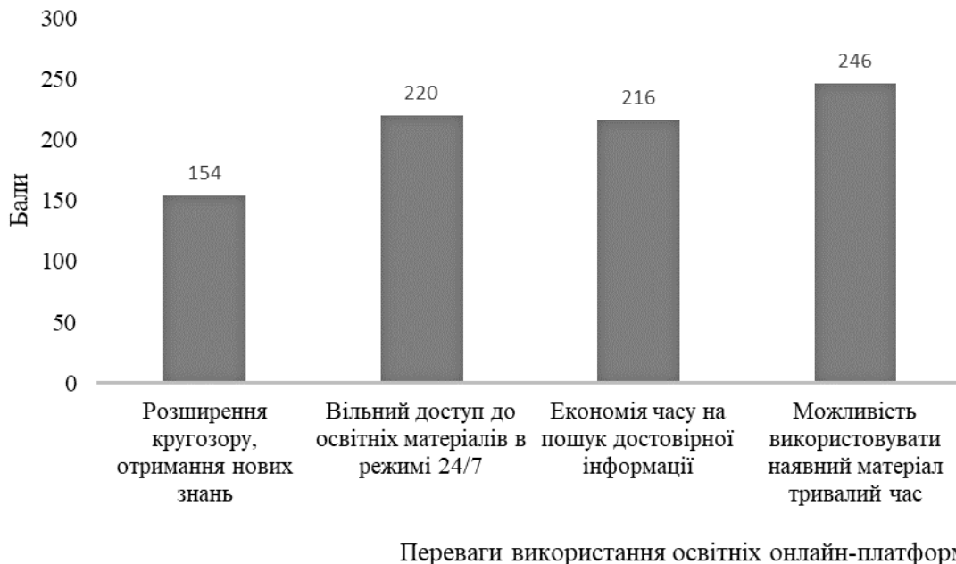
Рис. 4. Переваги, які може отримати молодий футболіст, використовуючи освітній матеріал, розміщений на спеціалізованих онлайн платформах, думка спортсменів (n=95)

Юні респонденти, в процесі проведеного опитування, також виділили переваги, які може отримати молодий футболіст, використовуючи освітній матеріал, розміщений на спеціалізованих онлайн платформах (рис. 4).