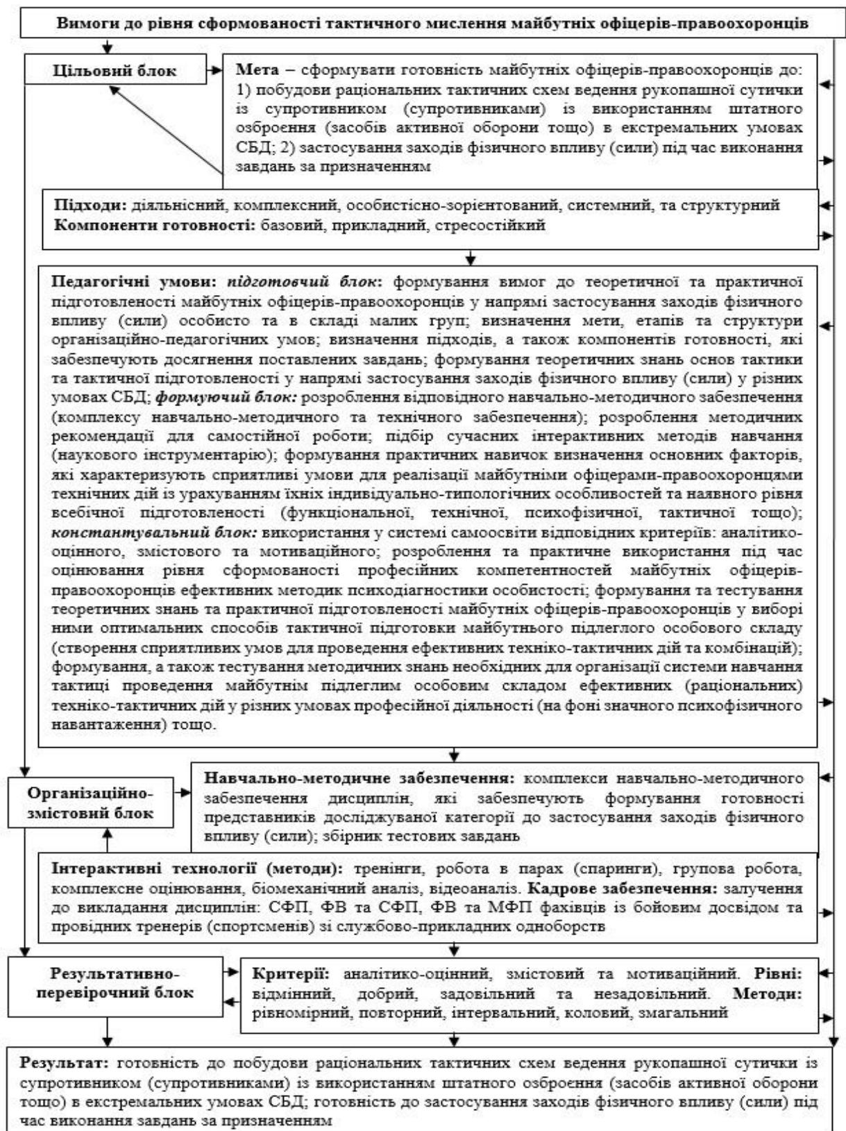
Рис. 1. Змістово-функціональна модель формування готовності майбутніх офіцерів-правоохоронців до застосування тактичних схем ведення рукопашної сутички із супротивником

Необхідно підкреслити, що майбутні офіцери Кг та Ег суттєво не розрізнялися за рівнем сформованості готовності до застосування тактичних схем ведення рукопашної сутички із супротивником (супротивниками) у змодельованих екстремальних умовах СБД, завдяки чому була забезпечена однорідність складу досліджуваних груп на початку проведення педагогічного експерименту. Надалі з дотриманням теоретичних положень членами НДГ було проведено дослідно-експериментальну роботу (у 3 етапи: константувальний, формувальний та контрольний).