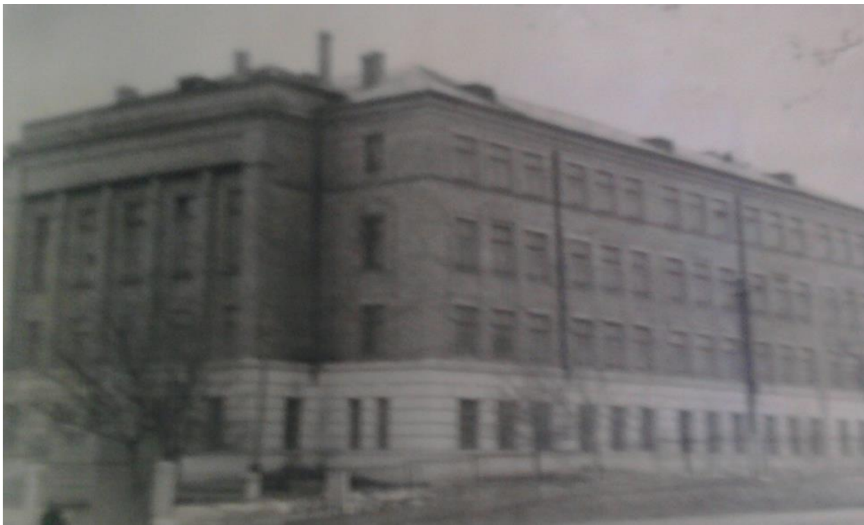
Додаток В.5. Загальний вигляд Ніжинського педагогічного інституту імені М.В.Гоголя [88, арк. 3]