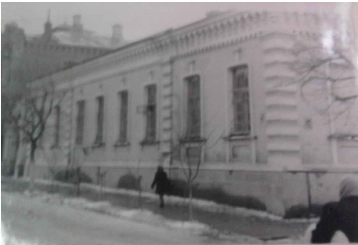
Додаток Д.3. Студентський гуртожиток Кременецького педагогічного інституту [87, арк.4]