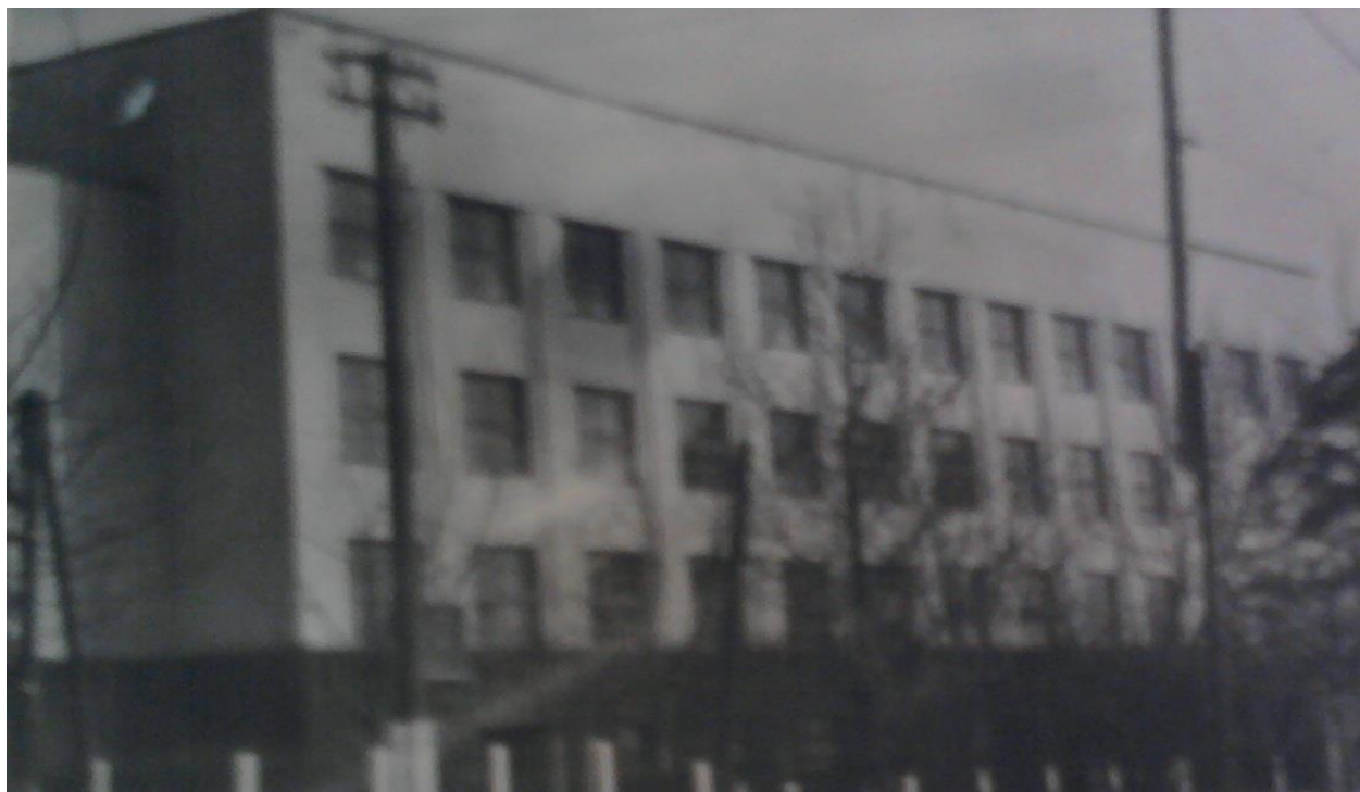
Додаток В.13. Головний навчальний корпус Нікопольського учительського інституту [94, арк. 4]