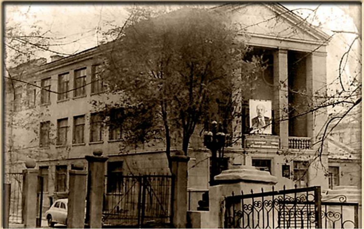
Перший будинок педінституту