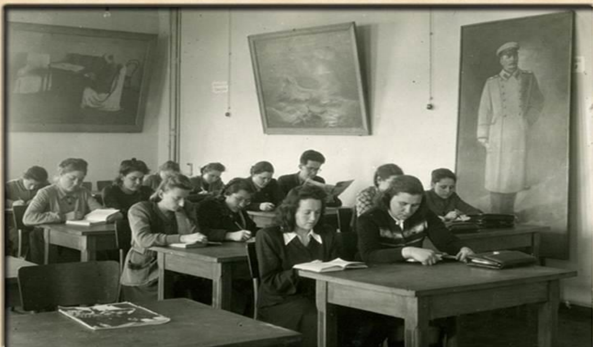
Педагогічний інститут (післявоєнні роки)