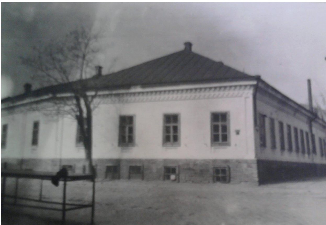
Додаток Ж.8.2. Житловий будинок №2 Нікопольського учительського інституту [94, арк. 6]