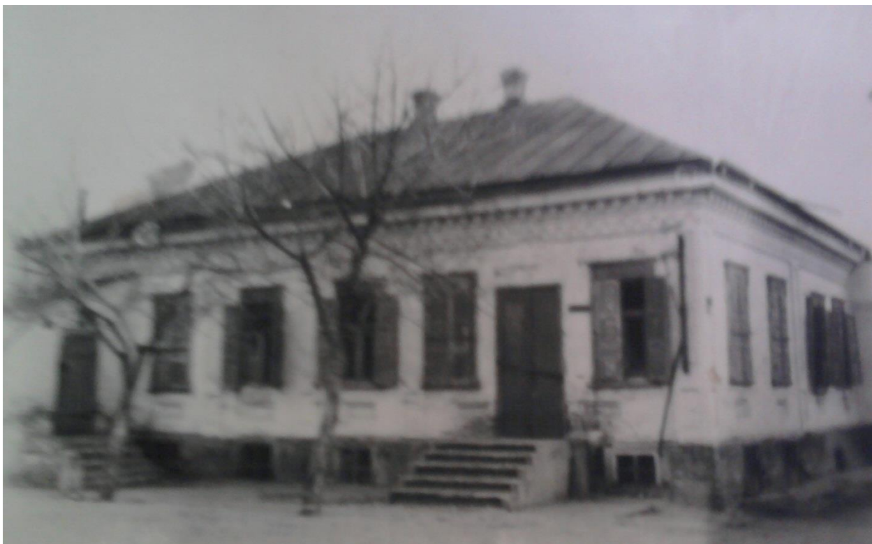
Додаток Ж.9.1. Житловий будинок Слов'янського учительського інституту (вул. Шевченка, 46) [96, арк. 6]