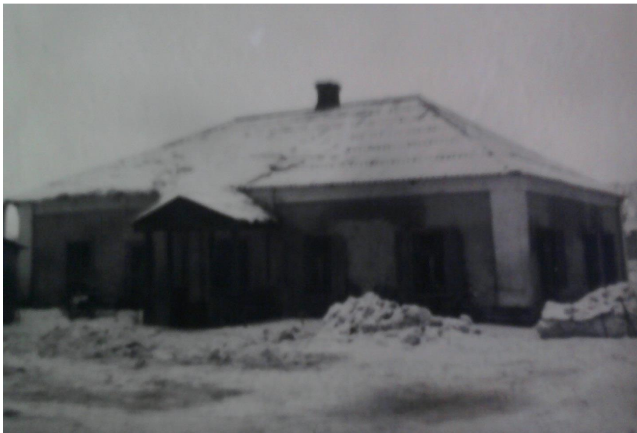
Додаток Ж.5.4. Житловий будинок Полтавського педагогічного інституту (вул. Сковороди, 4) [89, арк. 8]