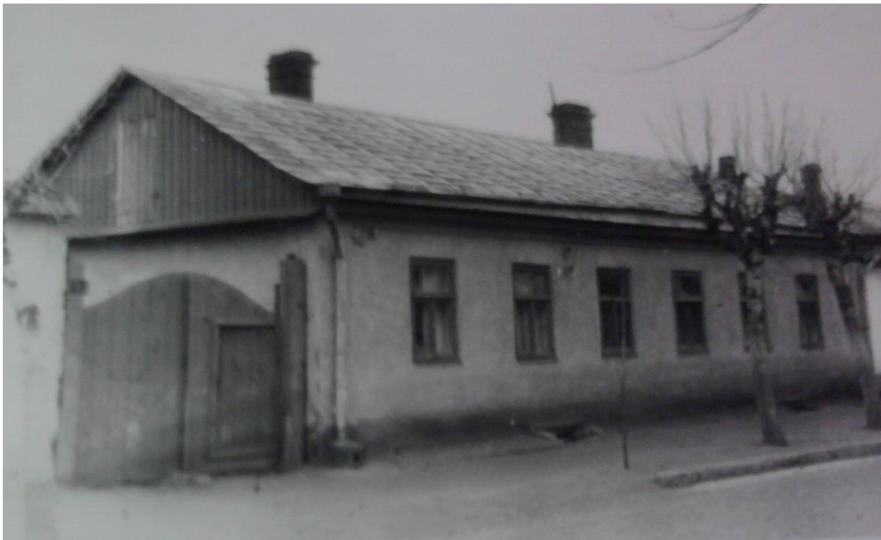
Додаток Ж.7. Житловий будинок Луцького учительського інституту (вул. Некрасова, 5) [93, арк. 5]