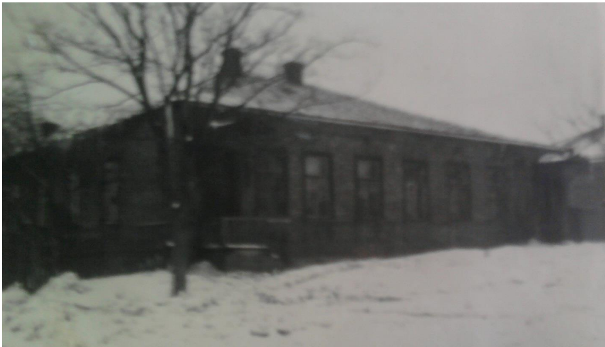
Додаток Ж.5.2. Житловий будинок Полтавського педагогічного інституту (вул. Комсомольська, 12) [89, арк. 5]