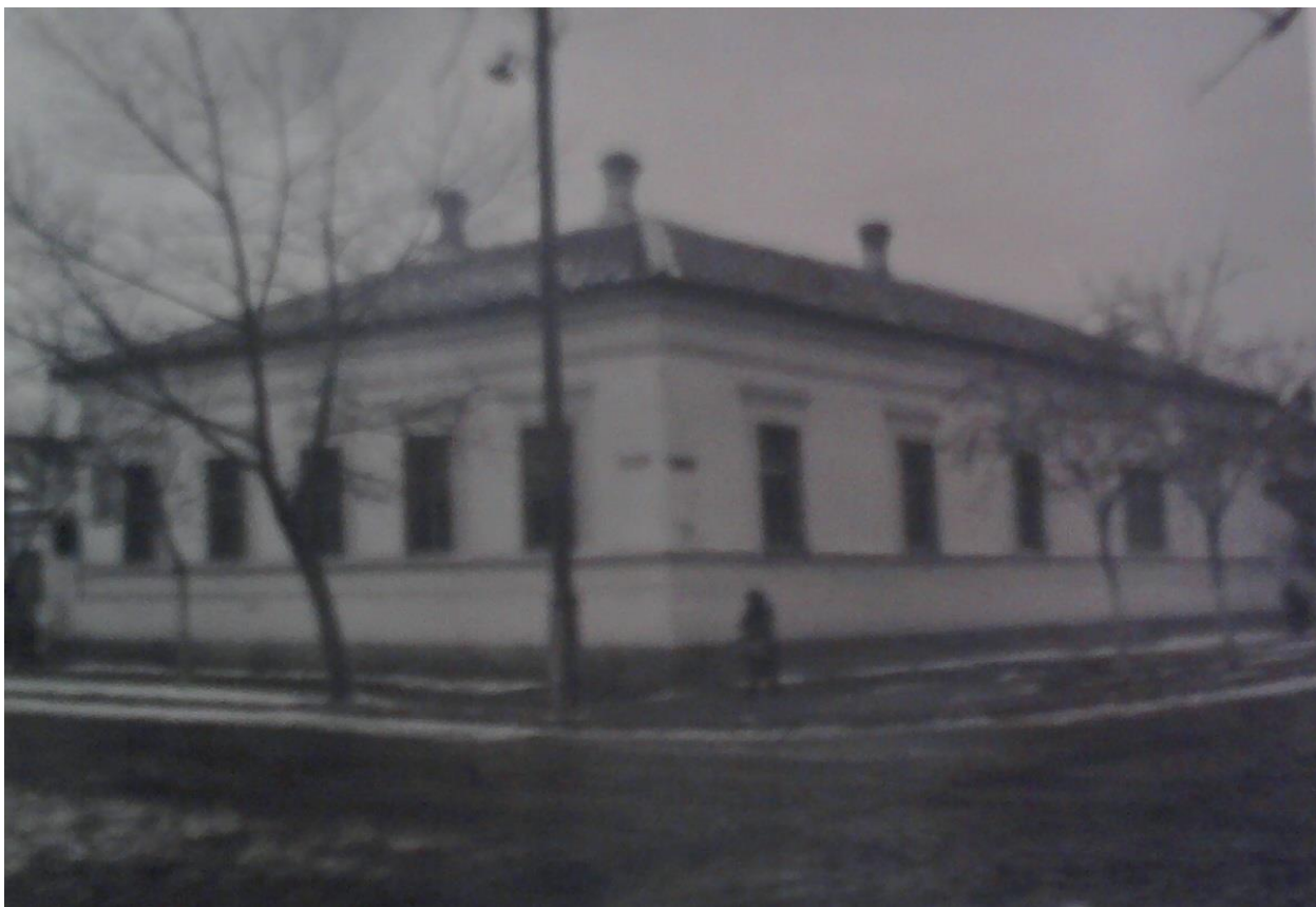
Додаток В.15. Навчальний корпус Слов'янського учительського інституту [96, арк. 4]