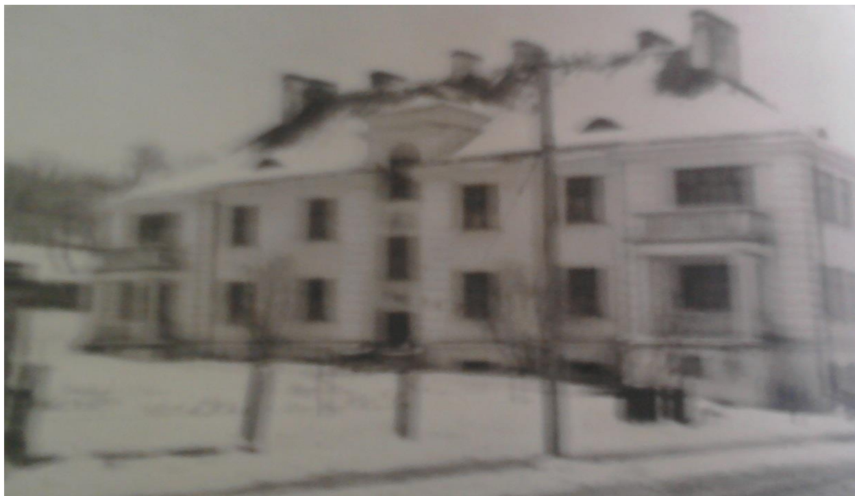
Додаток Ж. 4. Житловий будинок-квартири професорсько-викладацького складу Ніжинського педагогічного інституту імені М.В.Гоголя [88, арк. 5]