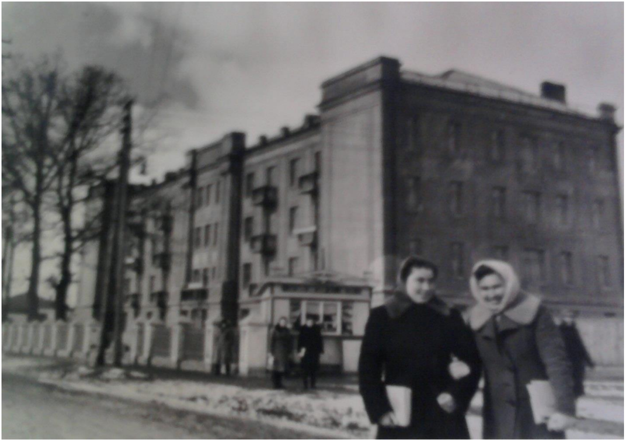
Додаток Д.5. Студентський гуртожиток Полтавського педагогічного інституту [89, арк. 4]