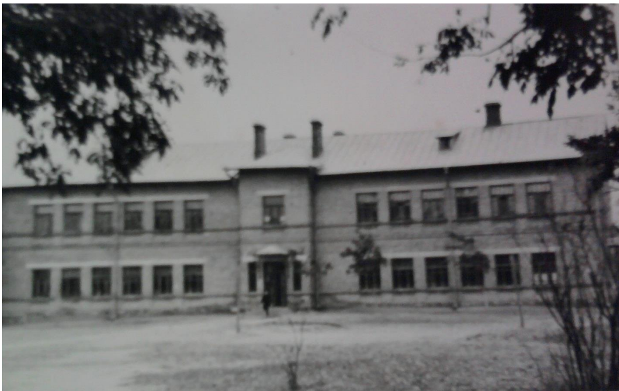
Додаток Д.8. Студентський гуртожиток Луцького учительського інституту [93, арк. 5]