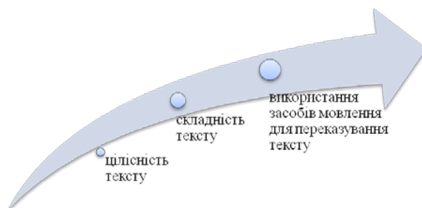
Рис. 2. Критерії оцінювання розуміння тексту дітьми дошкільного віку

Під час аналізу результатів дослідження враховували певні основні критерії розуміння тексту (рис. 2).