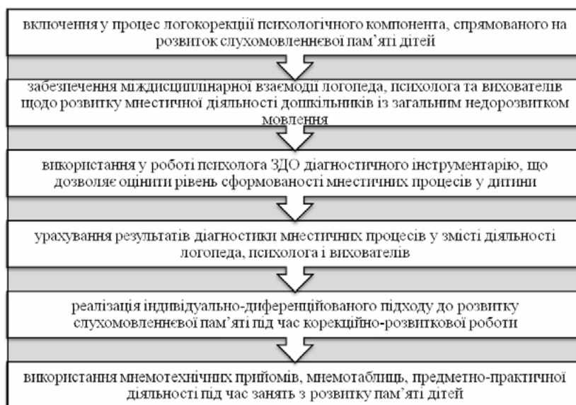
Рис. 3. Педагогічні умови удосконалення корекційно-розвиткової роботи зі старшими дошкільниками із ЗНМ

Корекційна робота з розвитку пам'яті в системі логопедичної допомоги дітям із ЗНМ включала три блоки: діагностичний, корекційно-розвитковий, аналітичний (моніторинг), реалізація яких передбачала взаємодію фахівців, які працюють у ЗДО: вчителя-логопеда, психолога та вихователя. Реалізація завдань