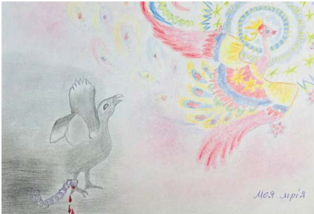
Рис. 1. «Сумна реальність», «Моя мрія»

Метод “Активного соціально-психологічного пізнання” (далі АСПП) спирається на візуалізацію, учасником занять, власної психіки. Малюнок самопрезентація особи звертає увагу специфікою підібраних сюжетів зображень, котрі часто виходять за рамки законів земного світу . Останні охоплюють не лише едіпальний , але й доедіпальний періоди розвитку людства, в якому ігнорувався “принцип реальності”. Наше відкриття пов'язане із значущістю введеної нами у науковий обіг підструктури “Зверх-Воно”.