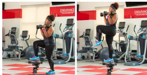
Рисунок 2.3. Кроки на платформу з гантелями

Вихідне положення: встаньте перед платформою, ноги на ширині стегон, гантелі в руках, долонями всередину або руки на рівні плечей. Лопатки прижати до спини (плечі вниз та назад). Намагайтеся не піднімати плечі.