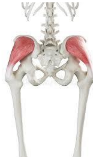
Рисунок 1.2. Середній сідничний м'яз

Щоб знайти середній сідничний м'яз, встаньте, поклавши руки з боків стегон, нижче крила клубової кістки. Станьте на одну ногу, а іншу відведіть у бік. Ви повинні відчути, як скорочується м'яз безпосередньо під рукою відвідної ноги. Це ваш середній сідничний м'яз.