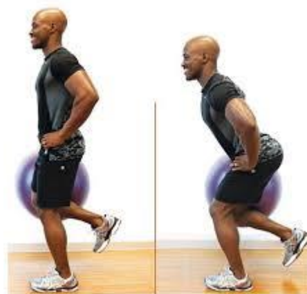
Рисунок 2.17. Присідання на одній нозі з підніманням ноги

2) додаванням зовнішнього опору, тримаючи гантель в одній руці або медичний м'яч в обох руках;