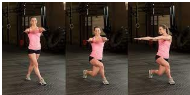
Рисунок 2.13. Випад активації сідниць

Виконання вправи: напружте м'язи черевного пресу та ядра, щоб зміцнити хребет. зробіть схресний крок правою ногою (обидві ноги