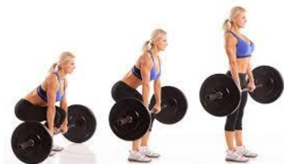
Рисунок 2.35. Стандартна станова тяга

Виконання вправи: злегка зігніться в стегнах, зберігаючи пряму спину, щоб грудна клітка була піднята вгору і нахиліться вперед, щоб взяти штангу в руки, однією рукою зверху, а іншою знизу. Стисніть штангу в руках і опустіться вниз, притискаючи стопи до підлоги. Тримаючи спину рівною, витягніть стегна вперед, щоб перейти в