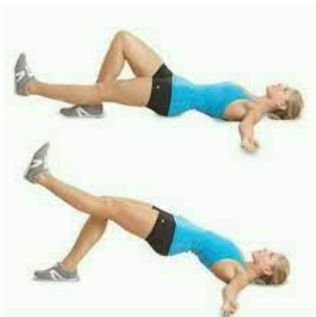
Рисунок 2.23. Сідничний міст з опусканням ноги

Вихідне положення: ляжте на спину на килимок, одна нога зігнута в