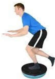
Рисунок 2.18. Присідання на одній нозі на нестабільній поверхні

3) згинанням та/або опускання стегон ближче до землі, збільшуючи згин колін;