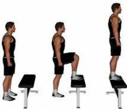
Рисунок 2.1. Кроки на платформу (без обтяження)

Виконання вправи: повільно зробіть крок, щоб поставити праву ногу