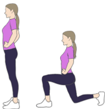
Рисунок 2.11. Випад назад

Виконання вправи: правою ногою зробіть крок назад і опустіть праве коліно до підлоги, створюючи кут 90 градусів. Відштовхніть праву ногу, щоб повернутися у вихідне положення. Повторіть випад на ліву ногу. Зробіть 10-12 повторень. Для найкращих результатів зробіть усі повтори на одній нозі, перш ніж перейти на іншу