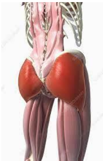
Рисунок 1.1. Великий сідничний м'яз

Великий сідничний м'яз є найбільшим та розташований на поверхні і більшою мірою визначає форму сідниць. Він починається від зовнішньої