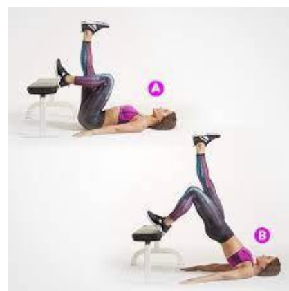
Рисунок 2.30. Тяга стегнами від лави на одній нозі

Виконання вправи: надавлюючи п'яткою на лаву, піднімайте стегна, стискаючи сідничний м'яз, поки тіло не утворить пряму лінію від плечей до колін, потім повільно опустіться у вихідне положення. Зробіть 2-3 підходи по 10-12 повторень на кожну ногу.