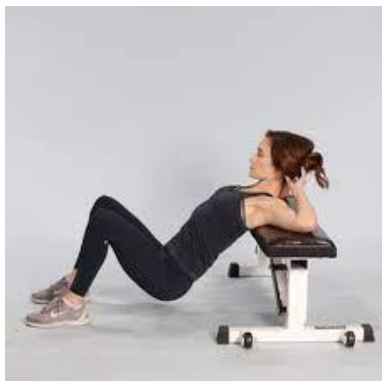
Рисунок 2.27. Тяга стегнами (без обтяження)

Тримайте коліна зігнутими, а стопи рівно на підлозі, на ширині стегон. Ви