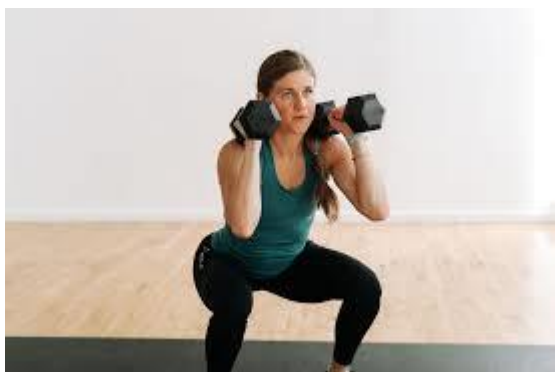
Рисунок 2.15. Присідання з гантелями

Виконання вправи: напружте м'язи черевного пресу та ядра, щоб