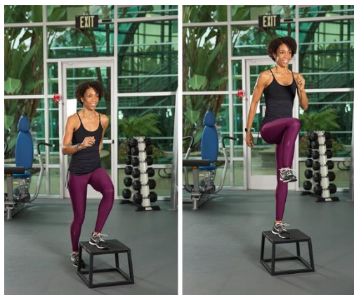
Рисунок 2.2. Кроки на платформу на одну ногу

Вихідне положення: встаньте перед платформою, ноги на ширині стегон, гантелі в руках, долонями всередину або руки на рівні плечей.