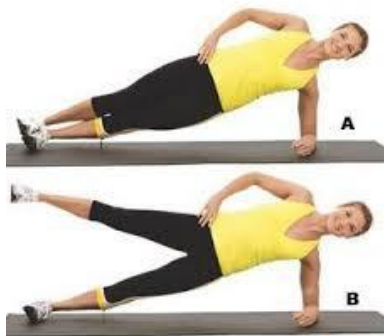
Рисунок 2.41. Відведення стегна в бічній планці

Виконання вправи: скоротіть м'язи живота та ядра, щоб зміцнити хребет, підніміть стегна і коліна від килимка, утримуючи контакт з правою