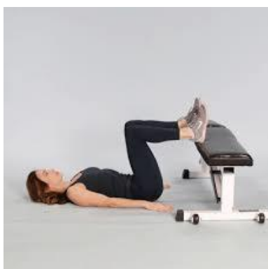
Рисунок 2.29. Тяга стегнами від лави

Вихідне положення: лежачи на спині, зігніть коліна і покладіть стопи на лаву, руки на підлозі.