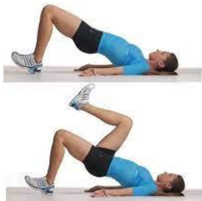
Рисунок 2.24. Кроки в сідничному мості

напружте м'язи живота, щоб стабілізувати хребет. Намагайтеся підтримувати це м'яке напруження м'язів протягом всієї вправи.