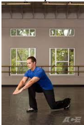
Рисунок 2.12. Випад вперед з руками

Виконання вправи: готуючись зробити крок вперед, повільно підніміть одну ногу від підлоги, стабілізуючи тіло на опорній нозі. Уникайте будь-яких нахилів убік або розгойдування верхньої частини тіла і намагайтеся не рухати опорною ногою. Затримайтеся в цьому положенні на мить, перш ніж зробити крок вперед. Піднята (махова) нога повинна