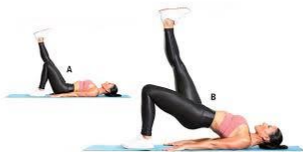
Рисунок 2.22. Сідничний міст на одній нозі

Виконання вправи: підніміть ліву ногу вгору прямою або зігнутою. На видиху підніміть стегна від підлоги, поки ваше тіло не утворило пряму лінію від колін до плечей, уникаючи занадто високого