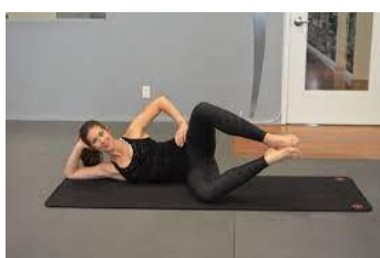
Рисунок 2.38. «Нахилений молюск»

Зробіть 2-3 підходи по 12-15 повторень на кожну ногу.