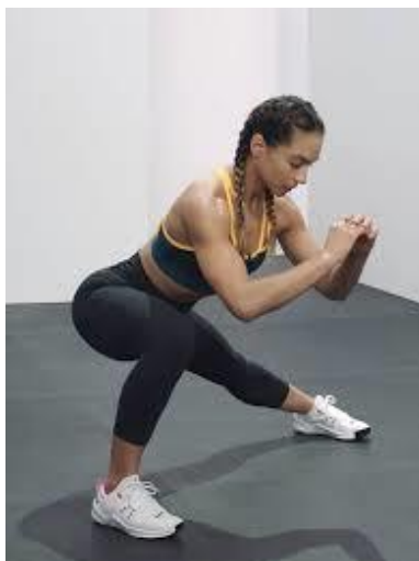
Рисунок 2.10. Латеральний випад

Вихідне положення: ноги на ширині стегон, стопи паралельно одна одній. Розташуйте руки так, де зручно буде зберігати рівновагу під час виконання вправи. Напружте тулуб, скорочуючи м'язи живота та ядра.