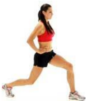
Рисунок 2.6. Частковий випад

Цей варіант виконання вправи передбачає менший діапазон рухів, тому що ви опускаєтеся лише наполовину, ніж у стандартному випаді, зупиняючись задовго до того, як ваше переднє коліно стане під кутом 90 градусів. Це може допомогти вам підтримувати правильну техніку виконання вправи, не надаючи великого навантаження на колінні суглоби.