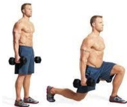
Рисунок 2.9. Випад вперед з гантелями

Ви також можете робити випад вперед з гантелями для збільшення інтенсивності навантаження. Оскільки цей варіант вправи вимагає більшої рівноваги, його слід спробувати лише після того, як ви зможете освоїти базовий випад.