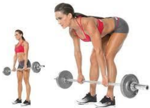
Рисунок 2.32. Румунська станова тяга

Виконання вправи: щоб розпочати рух, відведіть стегна назад, коли ви нахилиєтеся вперед у стегнах, тримаючи хребет прямим. Опустіться до