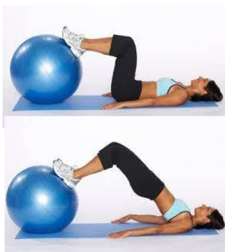
Рисунок 2.25. Сідничний міст на фітболі

Вихідне положення: лежачи на спині, зігніть коліна і покладіть стопи на фітбол.