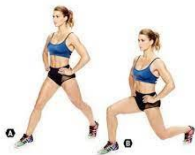
Рисунок 2.5. Випад (базовий)

Вихідне положення: розташуйте праву та ліву ноги дещо по діагоналі на відстані 60-90 см одна від одної. Ваш тулуб прямий, плечі відведені назад і опущені, м'язи ядра задіяні, руки на стегнах.