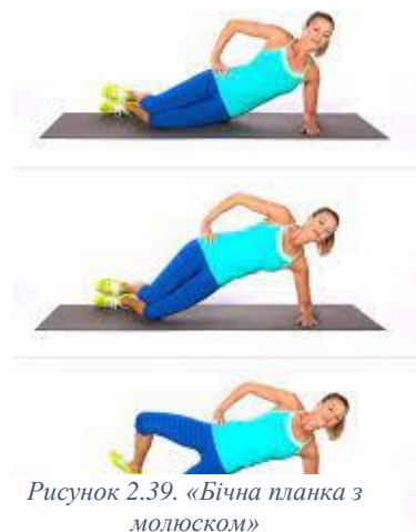
Рисунок 2.39. «Бічна планка з молюском»

Виконання вправи: тримайте нижнє коліно на підлозі і відштовхніться в модифіковану бічну