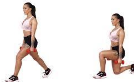
Рисунок 2.7. Випад з гантелями

Для збільшення інтенсивності вправи, тримаючи гантелі під час руху. Випад з гантелями виконується за тими ж основними правилами, за винятком того, що ви тримаєте гантелі в кожній руці. Почніть з легкої ваги гантелей і прогресуйте, коли ви зможете виконувати необхідні повторення з правильною технікою виконання.