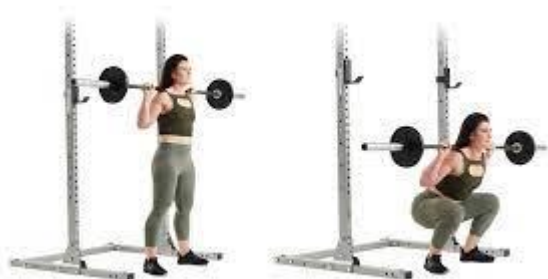
Рисунок 2.20. Присідання зі штангою

Вихідне положення: ноги трохи ширше, ніж ширина плечей. Лопатки прижати до спини (опустіть плечі вниз та назад).