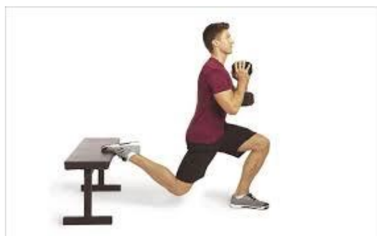
Рисунок 2.19. Болгарське спліт-присідання

Вихідне положення: ноги на ширині стегон, праву ногу вперед, а ліву поставте назад на лаву або стілець на висоті приблизно коліна.