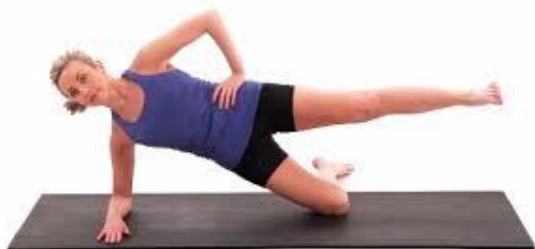
Рисунок 2.40. Відведення стегна в модифікованій бічній планці

Вихідне положення: ляжте на правий бік на килимок, ліва нога лежить прямо над правою ногою, зігніть коліна в зручне положення. Підніміть верхню частину тіла, щоб підтримувати праву руку, ваш правий лікоть повинен зігнутися на 90 градусів і розташуватися прямо під вашим плечем. Вирівняйте голову з хребтом на одній лінії та тримайте стегна та ноги на килимку. Підніміть стегна від килимка, зберігаючи контакт колін з килимком, голова на одному рівні з хребтом, верхню ногу випряміть.