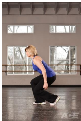
Рисунок 2.16. Присідання на одній нозі

Виконання вправи: вдихніть і натисніть правою ногою на підлогу, так