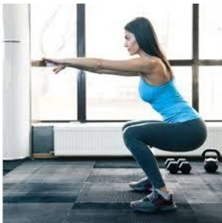
Рисунок 2.14. Базове присідання

Виконання вправи: напружте м'язи черевного пресу та ядра, щоб