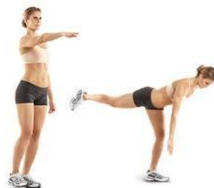
Рисунок 2.34. Румунська станова тяга на одній нозі

8-15 повторень на кожну ногу. Виконайте 2-3 підходи.