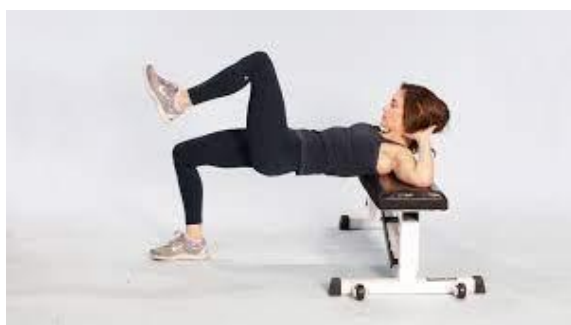
Рисунок 2.28. Тяга стегнами на одній нозі

Вихідне положення: обіпріться верхньою частиною спини в лаву, ноги зігнуті в колінах. Ізолюйте всі м'язи одного боку сідниць, підніміть зігнуту ліву ногу від підлоги. Ви можете спиратися ліктями на лаву. Ваші сідниці повинні трохи вище від