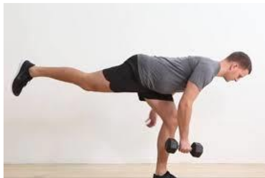
Рисунок 2.33. Румунська станова тяга на одній нозі з гантеллю

(нахилиючись вперед, випряміть праву ногу). Тримайте руку прямо, щоб