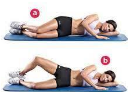
Рисунок 2.37. «Молюск»

Вихідне положення: ляжте на бік на килимок, зігнувши ноги під кутом 45 градусів. Нижня рука зігнута та розташовується під головою для підтримки, а верхня рука спирається на стегно або на підлогу. Ваша голова повинна бути на одному рівні з