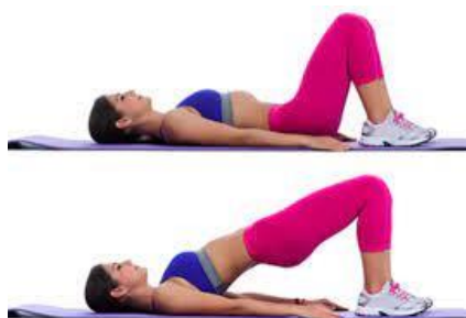
Рисунок 2.21. Базовий сідничний міст

Сідничний міст зміцнює сідниці та м'язи задньої поверхні стегна, одночасно підвищуючи стабільність ядра.