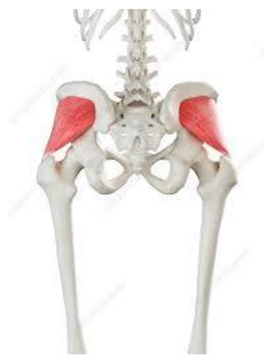
Рисунок 2.3. Малий сідничний м'яз

Найменший із сідничних м'язів – це малий сідничний м'яз. Він має багато подібних особливостей середнього сідничного м'яза, включаючи структуру та функції. Малий сідничний м'яз розташований під середнім